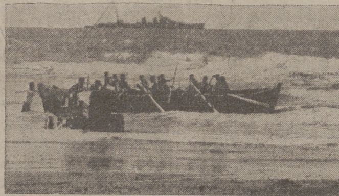
SIDI IFNI. — El abastecimiento de Sidi Ifni ofrece siempre la dificultad del mar abierto. Dos lanchones en lucha con las olas para llegar a la playa.