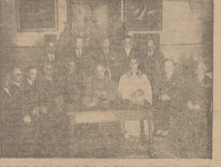
El Capítulo de Caballeros de María de Valvanera reunido con su Gran Prior.