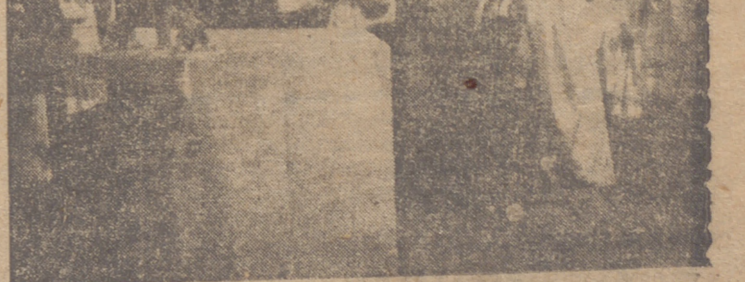
Momento de iniciarse la celebración de la santa misa.

A media tarde, los peregrinos acudieron de nuevo al Santuario, a hacer la visita de despedida a la Santísima Virgen y congregar seguidamente el viaje de regreso a sus respectivas localidades, terminando así una de las más brillantes jornadas valvanerianas.