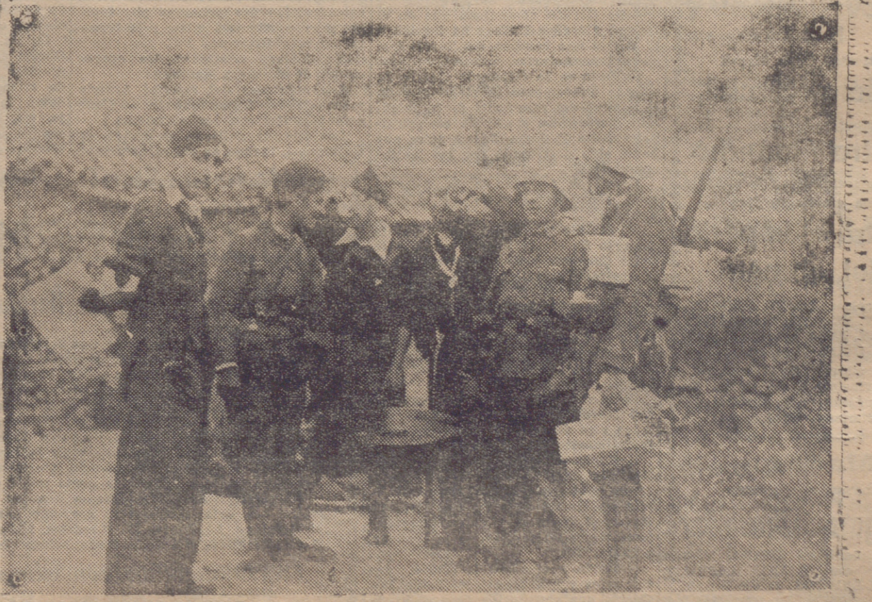
LOS JEFES DEL FRENTE PRUEBAN LA COMIDA ANTES DE SER SERVIDA A LAS TROPAS EN EL PUEBLO DE PIÑUECAS, LO MAS AVANZADO DEL FRENTE DE SOMOSIERRA