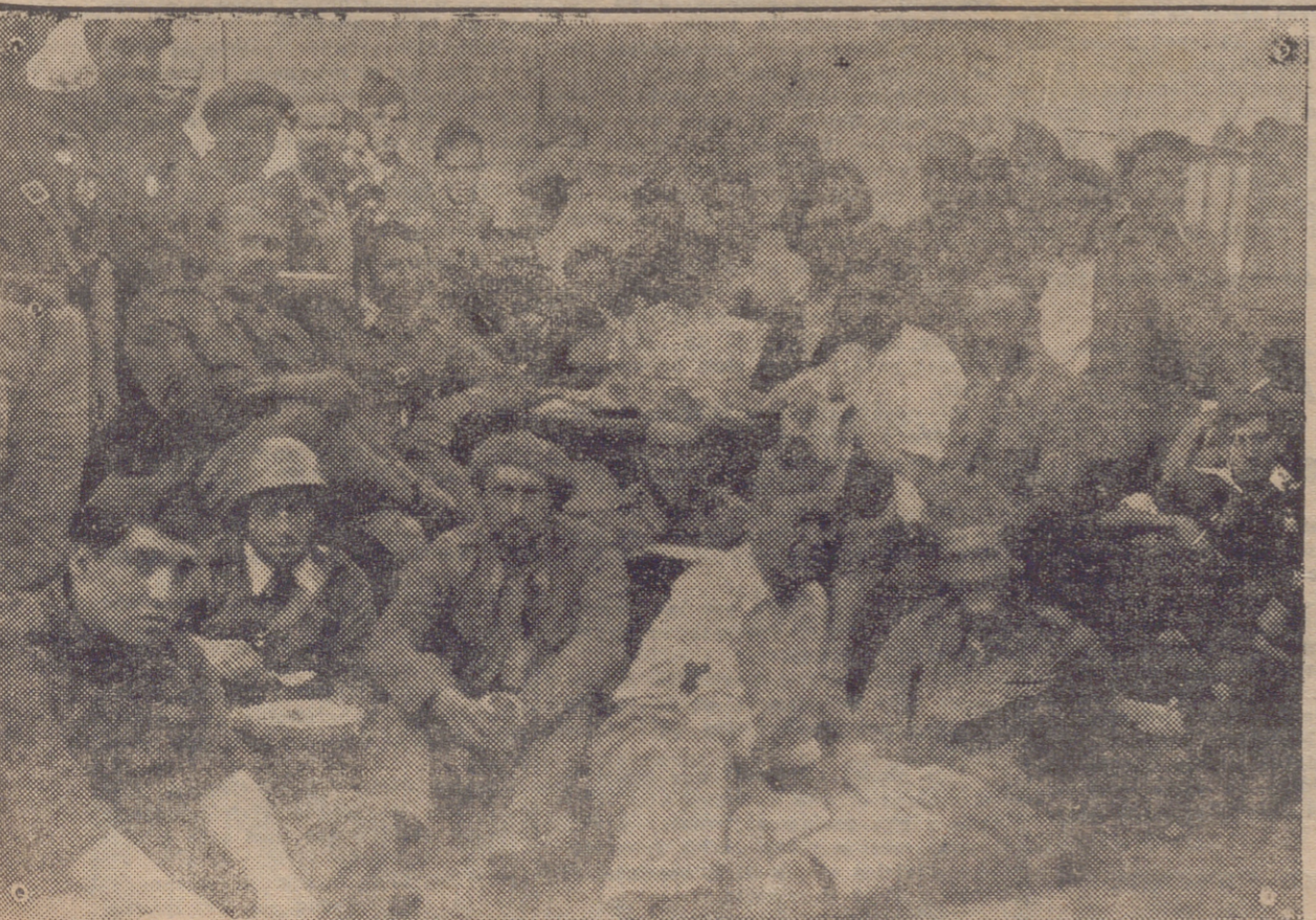
LEIDAS EN UN MOMENTO DE DESCANSO EN ROBREGORDO (FRENTE DE SOMOSIERRA)