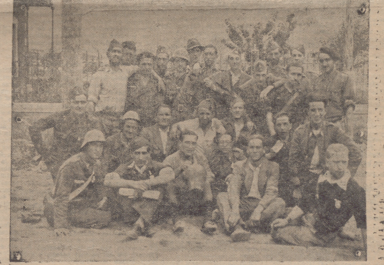
UN MOMENTO DE DESCANSO EN ROBREGORDO (FRENTE DE SOMOSIERRA)