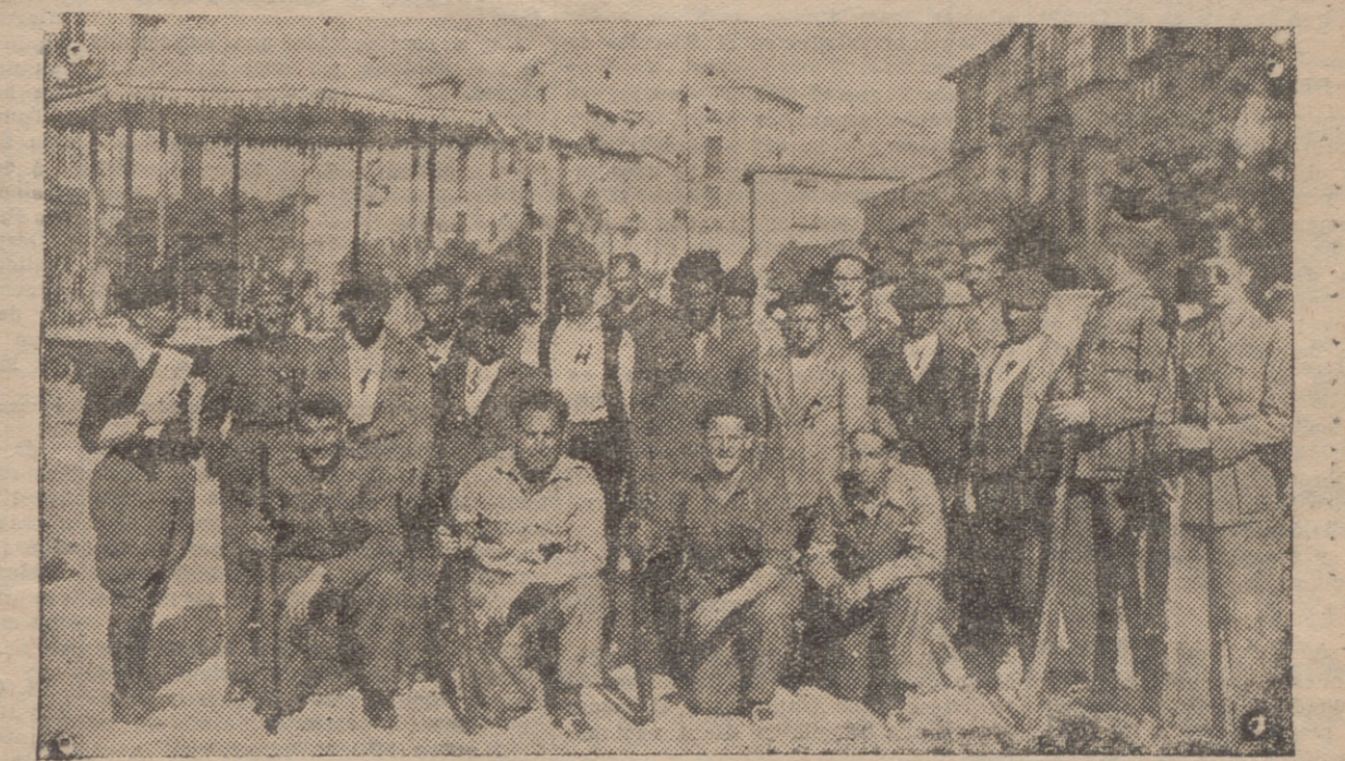
GRUPO DE PRISIONEROS MARXISTAS CAPTURADOS EN LA LINEA DE FUEGO DEL PUEBLO DE LASENA (FRENTE DE SOMOSIERRA)