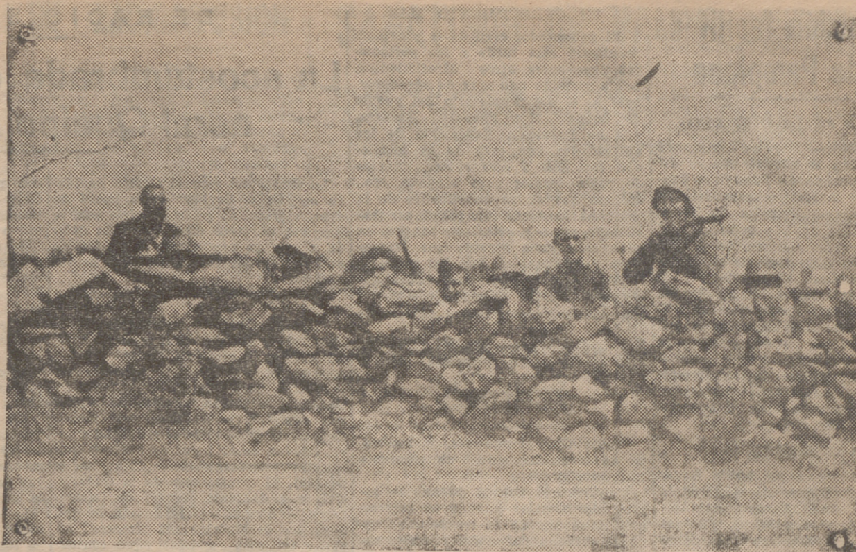
LO MAS AVANZADO EN LA LINEA DE FUEGO, A 200 METROS DE BUITRAGO (FRENTE DE SOMOSIERRA)