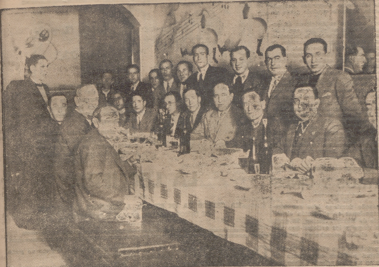
CAS DIRECTIVAS ENTRANTE Y SALIENTE DE "LA AMISTAD", REUNIDAS EN BANQUETE EL SABADO ULTIMO.