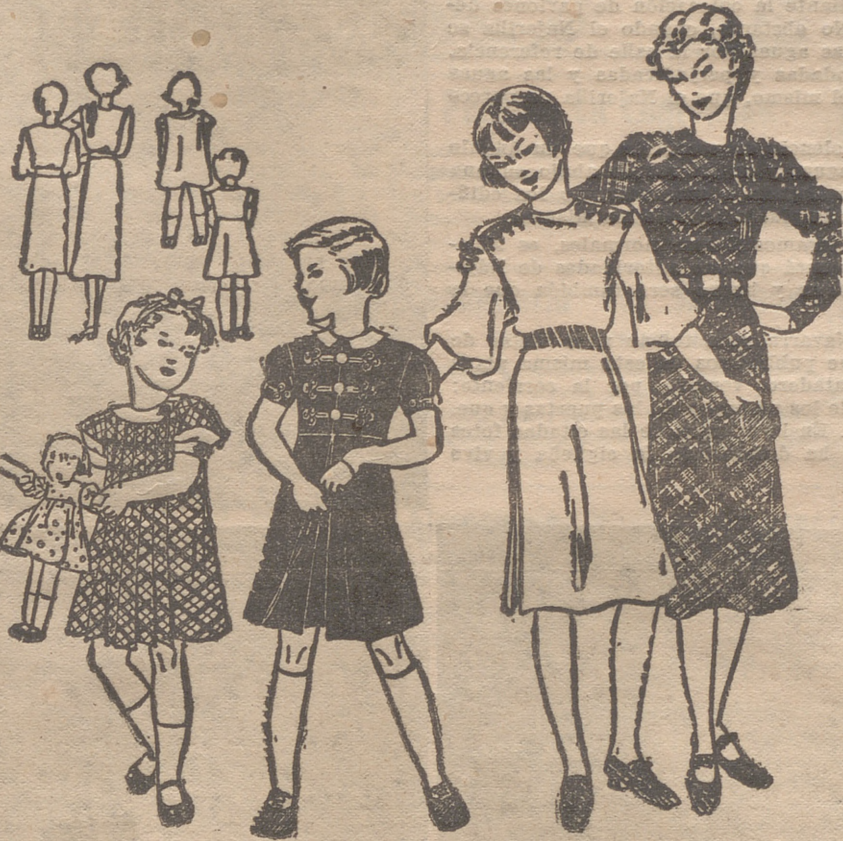
CUATRO LINDOS MODELOS PARA NIÑAS de diferentes edades.

dejarlos que aparezcan grises; cualquier tentativa de engaño no engaña más que a quien la practica. Admitamos abiertamente una edad dada —no tiene, ¡claro!, que ser la de la partida de bautismo— y tratemos de vestir a la señora con arreglo a ella. Lo primero que todos los materiales sean buenos, de dibujos muy definidos y superficies suaves; la "señora mayor" no puede aparecer jamás "negligée", ni puede permitirse experimentos con materiales nuevos. Pero no temamos a ningún género de colores, si tenemos en cuenta que personas de tez delicada no pueden llevar jamás colores rabiñosos. No proscribamos tampoco enteramente al negro; combinado con encajes blancos y una tez un poco fresca, puede hacerla aparecer aún más jo-