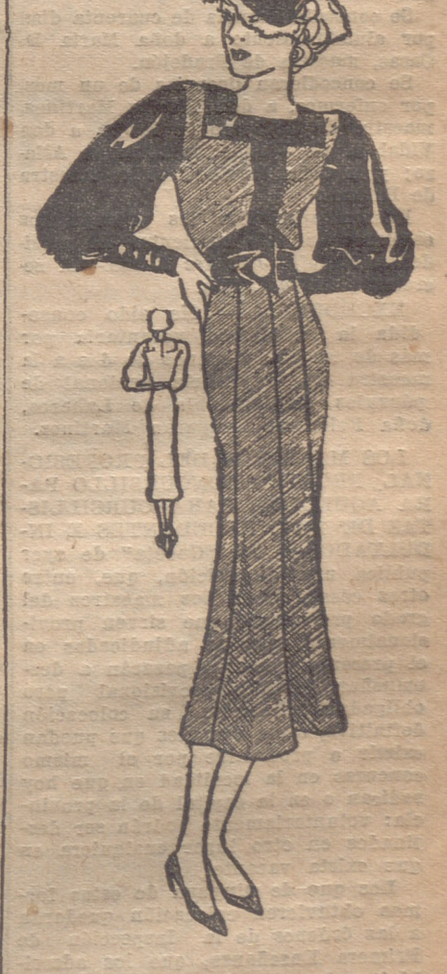
TRAJE de lana negra. Cuerpo adornado de un canesú cuadrado, de una banda y de un cinturón de terciopelo negro. Mangas de terciopelo negro. Botones en la espalda. Boucle triángular.

Lo primero que todos los materiales sean buenos, de dibujos muy definidos y superficies suaves; la "señora mayor" no puede aparecer jamás "negligée", ni puede permitirse experimentos con materiales nuevos. Pero no temamos a ningún género de colores, si tenemos en cuenta que personas de tez delicada no pueden llevar jamás colores rabiñosos. No proscribamos tampoco enteramente al negro; combinado con encajes blancos y una tez un poco fresca, puede hacerla aparecer aún más jo-