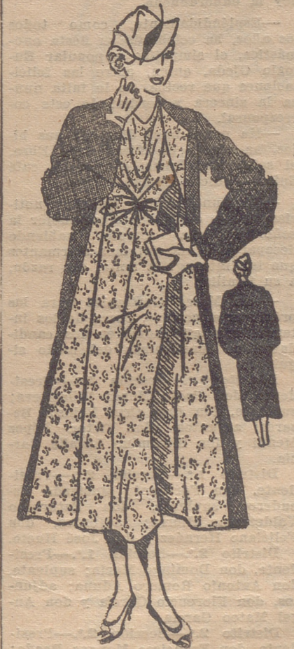
CONJUNTO compuesto de un vestido en jersey "satin" impreso y de un abrigo "tweed", forrado del mismo tejido del vestido.

Los hijos de la mujer y del hombre valientes son valientes ellos mismos porque se han templado y vigorizado en el ejemplo del valor... No hablemos del caso contrario: hijos fracasados y