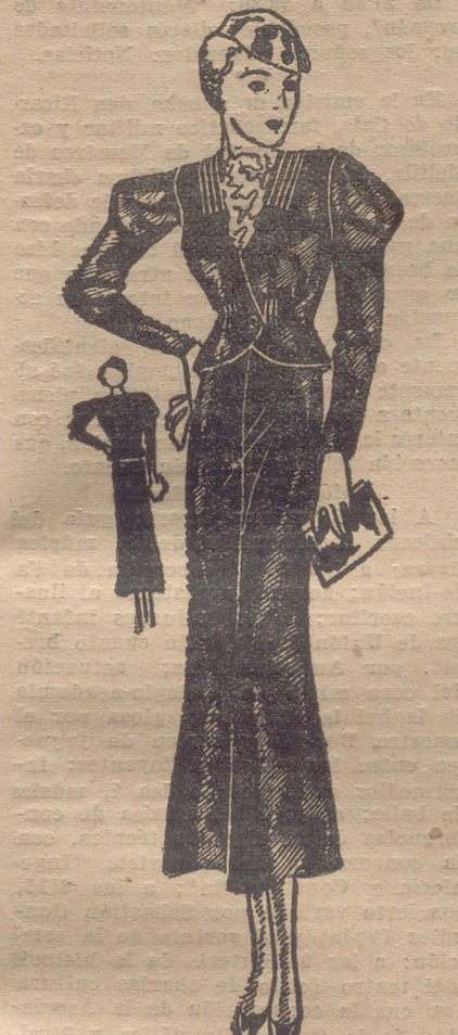
TRAJE SASTRE de taffetas negro. Falda recta. Chaqueta corta. Bandas de nervaduras a cada lado del escote y en la cintura. Botón de galatina negro.