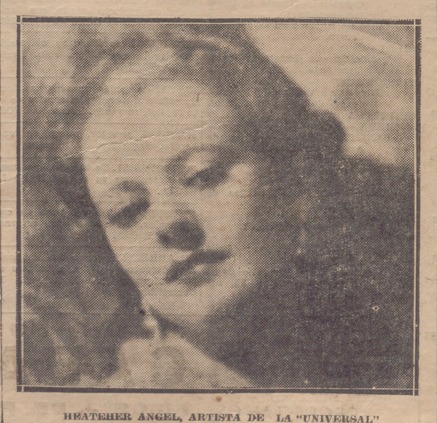
HEATEHER ANGEL, ARTISTA DE LA "UNIVERSAL"