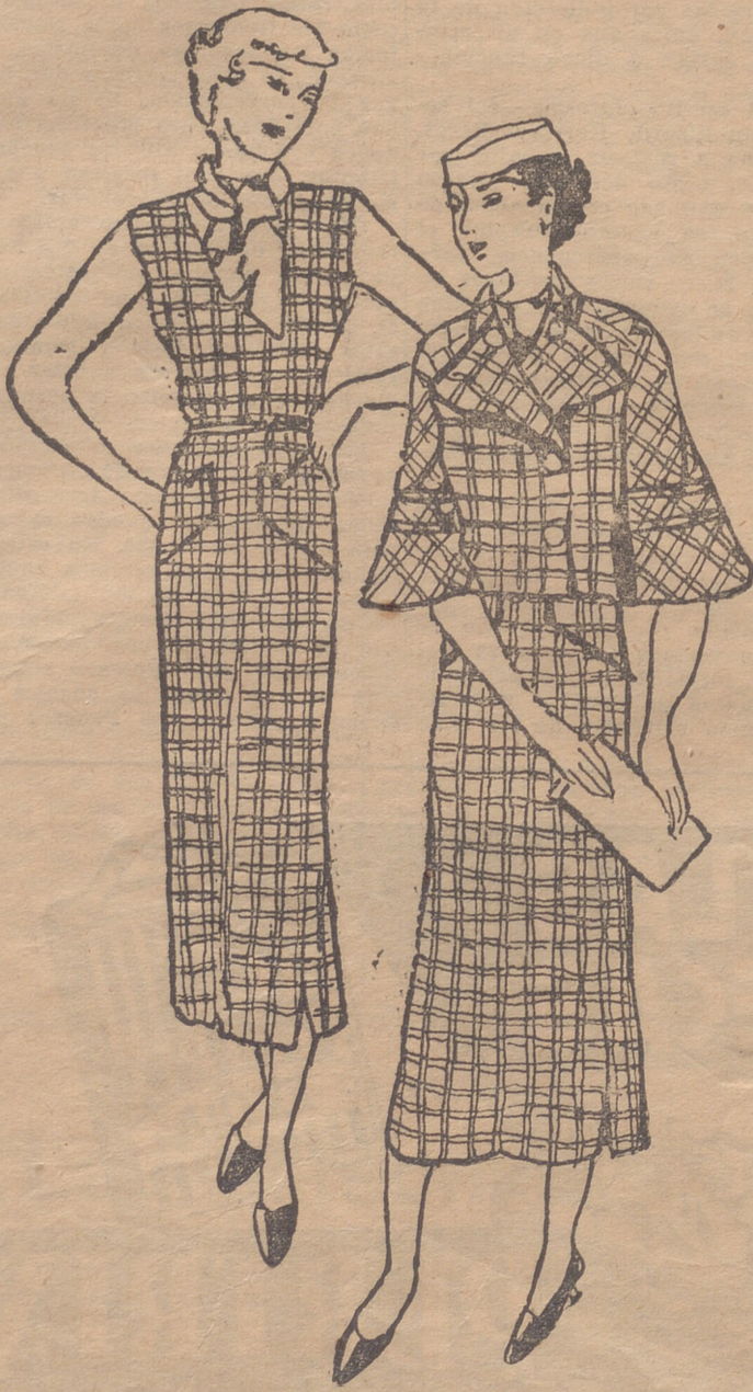
Conjunto de lana enredada marrón y beige. Vestido sin mangas. Echarpe de lana verde. Bolsillos en la falda. Chaqueta corta, mangas anchas ranglán y tres cuartas simulando capa. Botones dorados.

JUEGOS CAFE JAPONESES SEVRES Sagasta, 2. — Bajos Seminario.