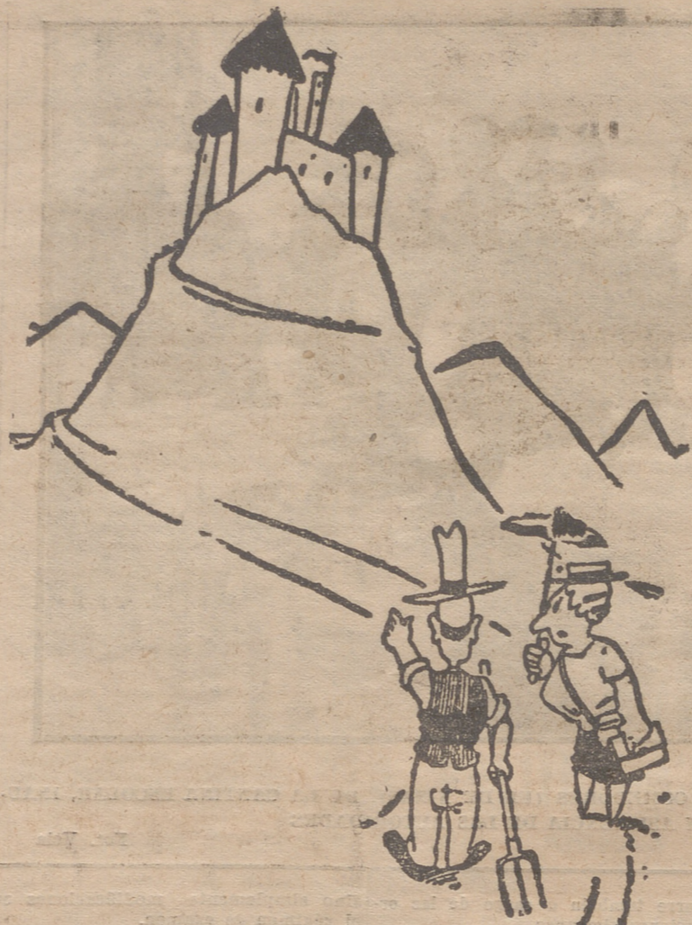
—¿Y usted cree de verdad que el castillo está encantado? —¡Cuando se lo digo yo, que soy el fantasma!