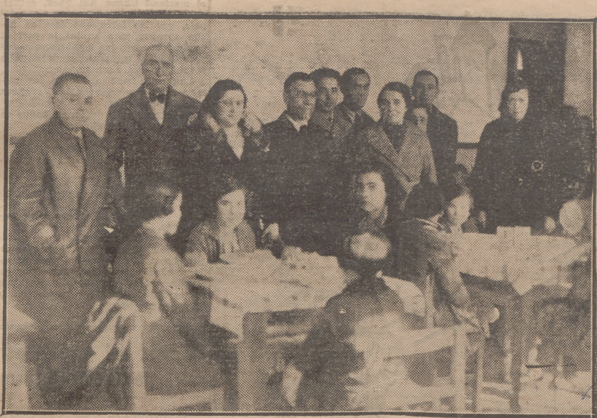
HARO.—UN ASPECTO DE UNO DE LOS COMEDORES (EL DE NIÑAS), DE LA CANTINA ESCOLAR, INAUGURADO CON ASISTENCIA DE LAS AUTORIDADES

HOY, SABADO A las 5 y a las 7'15 GRANDIOSO ESTRENO Producción Artistas Asociados ¿CAMPEON? ¡NARICES! Por JIMMY DURANTE (El narigón) Con LUPE VELEZ y STUAR ERWING Una comedia llena de gracia y humorismo, ingenio y originalidad NO DEJE DE VERLA Noche a las 10'30 Grandioso PROGRAMA DOBLE 1.º ESTRENO de la interesantísima película del Oeste ALMAS DE ACERO 2.º ¿Campeón? ¡Narices! Por Jimmy Durante y Lupe Vélez