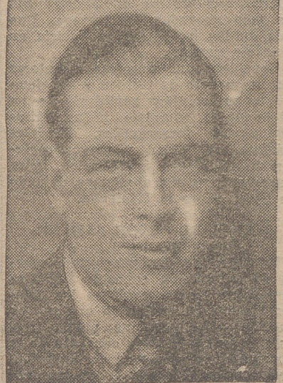
El príncipe inglés

promesa, o cambio de anillos, y la coronación con las coronas míticas. Para la promesa se colocan dos anillos, uno de oro y otro de plata, en la Mesa Santa. Los novios se arrodillan a la entrada del santuario y el sacerdote va a su encuentro, entregándoles cirios encendidos. Después bendice los anillos, y dichas las palabras de ritual, coloca el anillo en la mano del novio, diciendo tres veces: "El siervo del Señor se ha desposado". A continuación hace lo mismo con el anillo de plata, que coloca en la mano de la novia, diciendo: "La sierva del Señor se ha desposado", después de lo cual da la bendición a los novios.