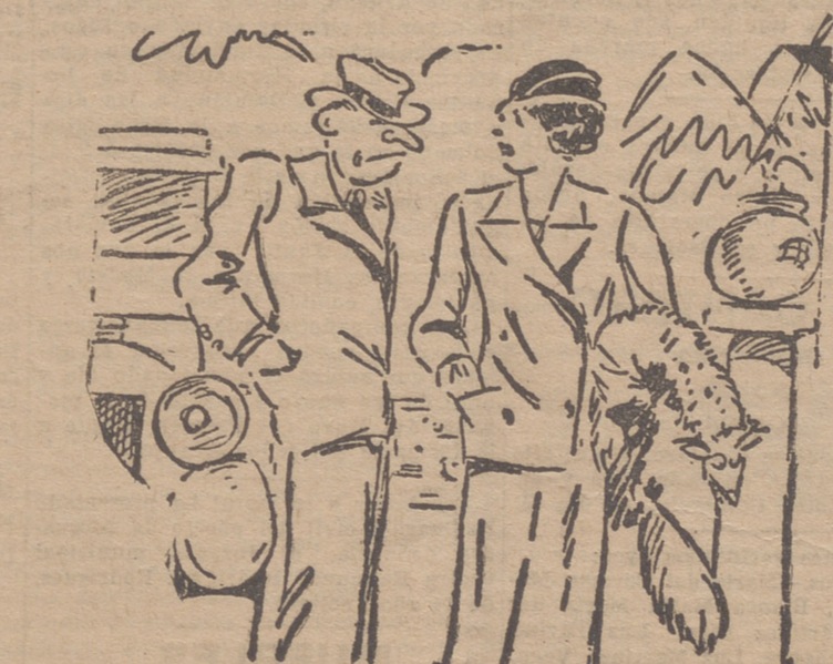
—No podemos comprar coche este año. Debemos pensar en pagar nuestros deudas... —Y no lo podemos pensar dentro del coche?

LA HABANA.—Como consecuencia de los hallazgos de armas realizados en un vagón de mercancías, han sido detenidos numerosos soldados, policías y paisanos.