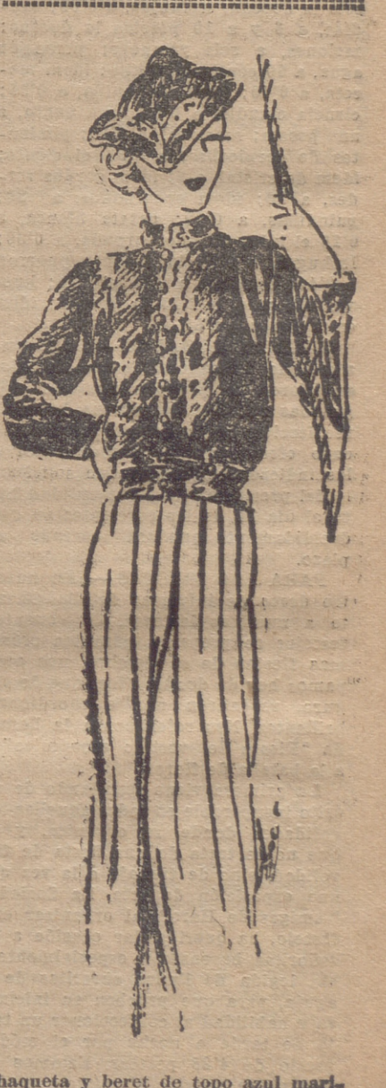
Chaqueta y beret de topo azul marino, que son muy elegantes y quedan muy bien sobre una falda blanca de lanita o crepé de seda grueso.

Claro está que nos dirigiremos a los "hombres solos", pues los "otros" allá (Continúa en la página siguiente)