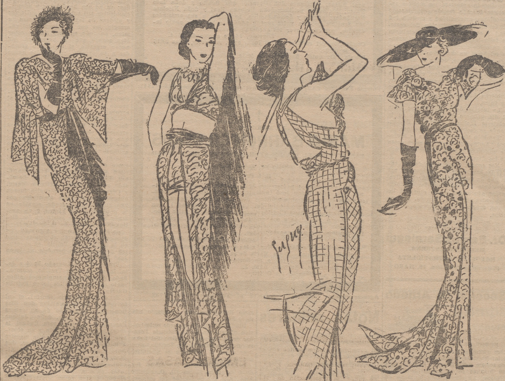
Vestido de encaje color topo, con una toca de picot negro y crosses.