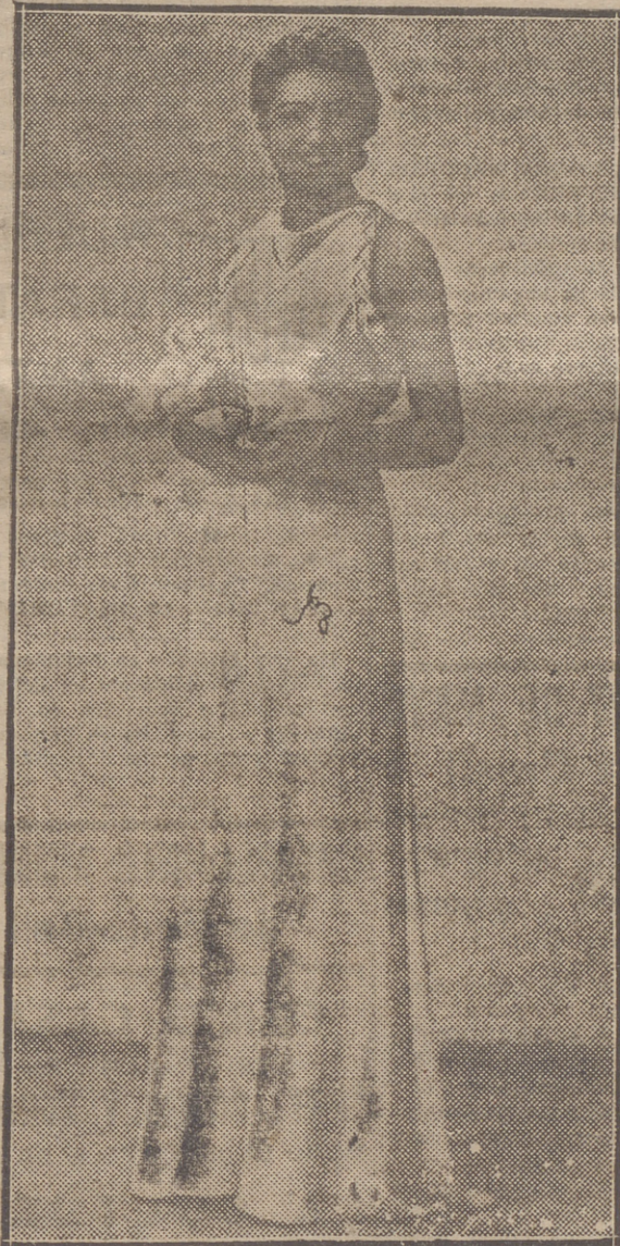
"MISS ARAGON", PREMIO DE CUERPO MAS PERFECTO