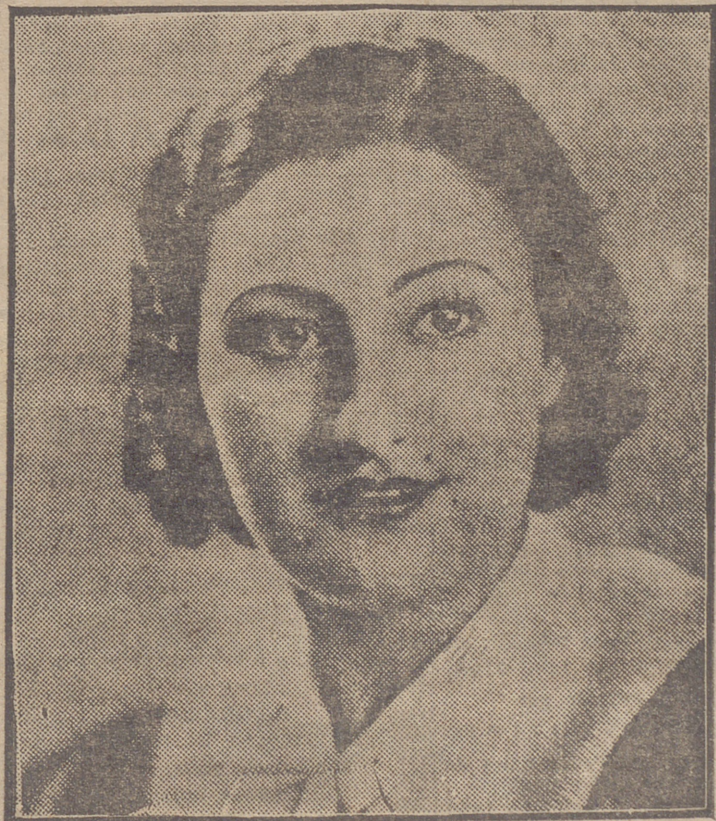
"MISS RIOJA", DE QUIEN TANTO SE ALABA LA ELEGANTE FIGURA

objeto durante el año pasado no fueron sino de 394.000 dólares.