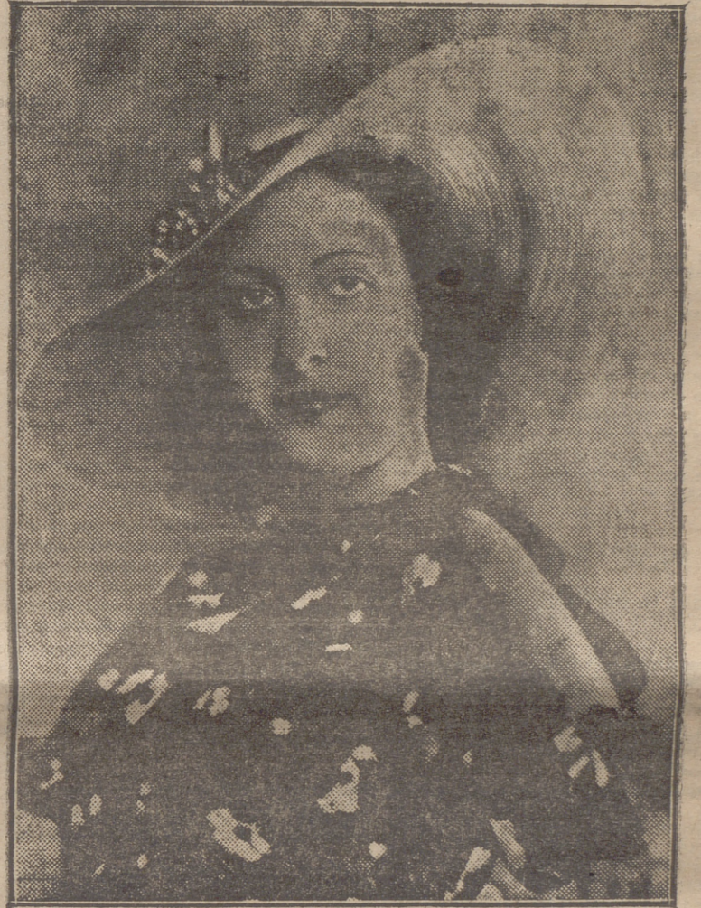
"MISS BALEARES", UNA DE LAS QUE SE SENALABAN COMO POSIBLE PREMIO DE CARA MAS BONITA

El tasador joyero viene en previsión de que puedan encontrarse pignoradas en España algunas de las joyas de Stavisky que desaparecieron y parte de las cuales fueron encontradas ya en una casa de préstamos de Londres. La Policía española ha dado toda