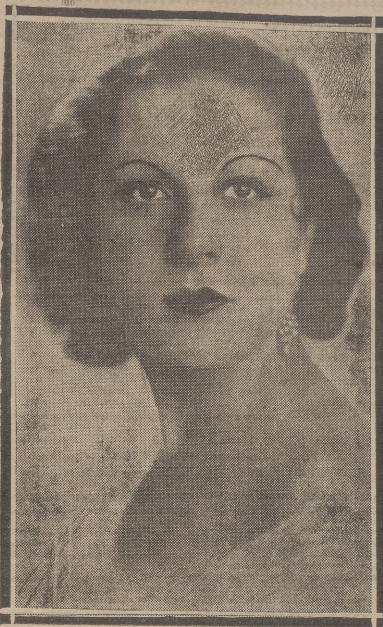
"MISS PROVINCIAS", elegida "Miss España"

Las sumas invertidas durante el mes de abril por Alemania en los Estados Unidos en adquisición de material de aviación representaron 260.562 dólares, lo que eleva el total de gastos de esta índole desde enero de 1934, a 1.169.412 dólares. Las sumas invertidas con el mismo