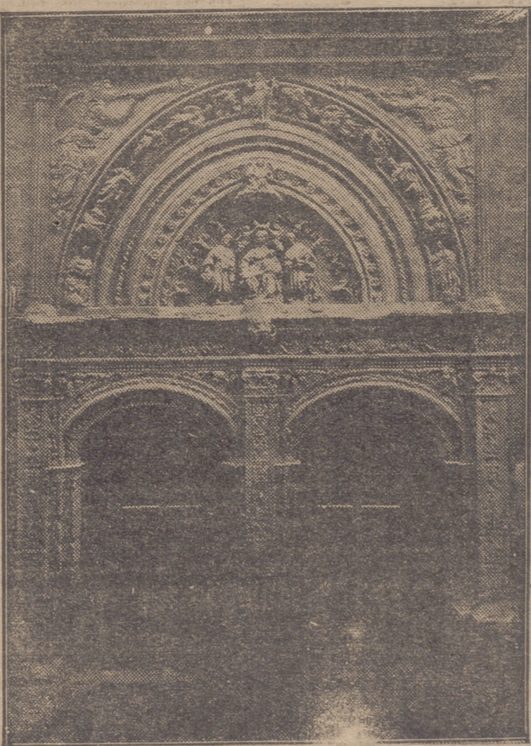
LAS PUERTAS DE SAN JERONIMO, EN LA CATEDRAL DE CALAHORRA, QUE INTENTARON INCENDIAR EN LA MADRUGADA DEL PASADO VIERNES.

LA RIOJA llega ahora a San Sebastián a mediodía y se vende en la Librería de Hijas de Aramburu, en el Bulevar, y Vda. de Ramón Rivero, Moraza, 17.