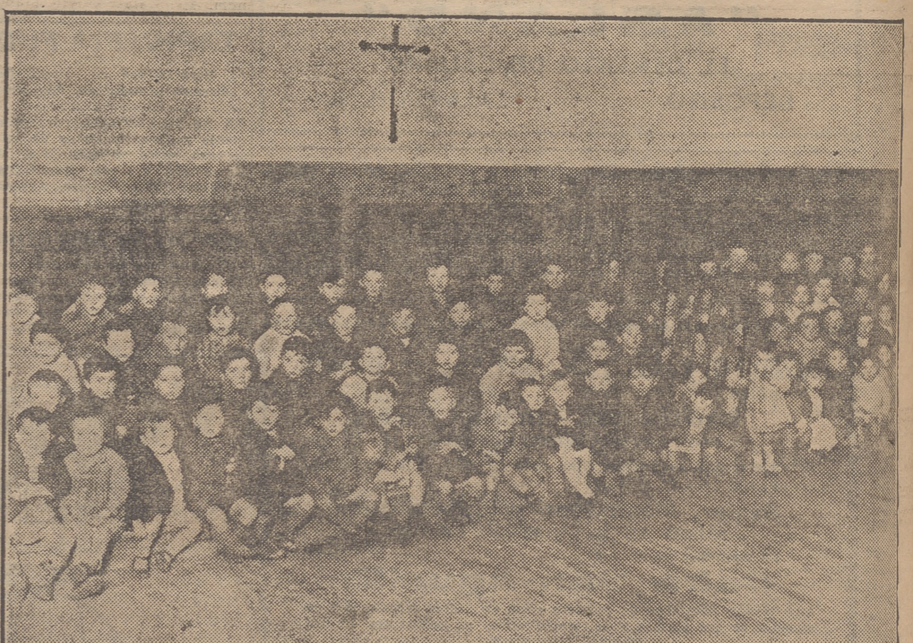
LOS PEQUENUELOS ANTE EL OBJETIVO DE NUESTRO FOTOGRAFO, MOMENTOS ANTES DEL REPARTO