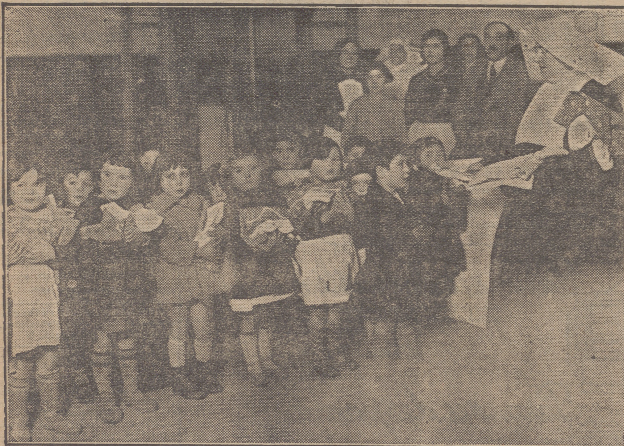
LA SUPERIORA EN EL ACTO DE ENTREGA DE PREMIOS A LOS NIÑOS