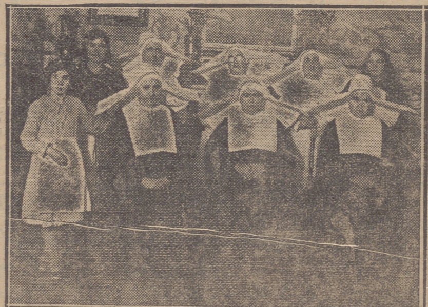
LA COMUNIDAD DE RELIGIOSAS DE SAN VICENTE DE PAUL, QUE TIENEN A SU CARGO EL ESTABLECIMIENTO Y LAS SEGLARES QUE LES AYUDAN