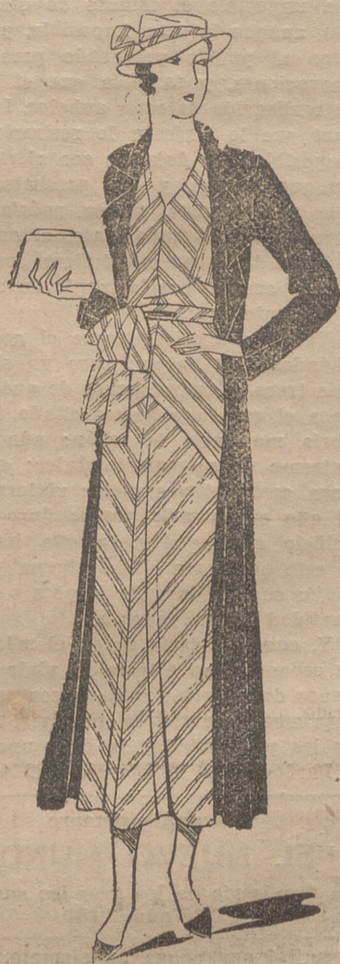
Vestido de muselina blanca, rayada, rojo. Abrigo de shantung rojo

En la hermosa pradera de Beyris, sembrada de hayas gigantes, se reúne el mundo elegante a las cinco de la tarde, a ver los partidos de polo. A la sombra de un bonito "cottage", junto a los viejos árboles, se desarrolla este juego, pleno de su or-