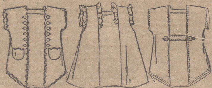
Tres encantadores modelitos para pequeños salones, de fácil ejecución.