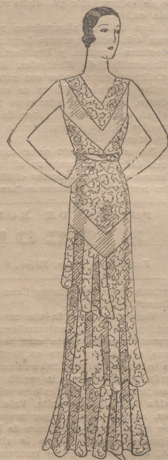
Vestido de encaje y crepé georgette verde