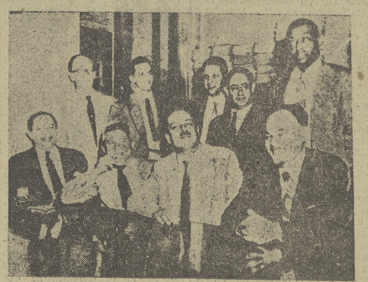
Estos son los comunistas declarados culpables por el Tribunal Federal de Filadelfia, de enseñar y fomentar el derrumbamiento del Gobierno por la violencia. Tras la sonrisa, to da una teoría del terror.