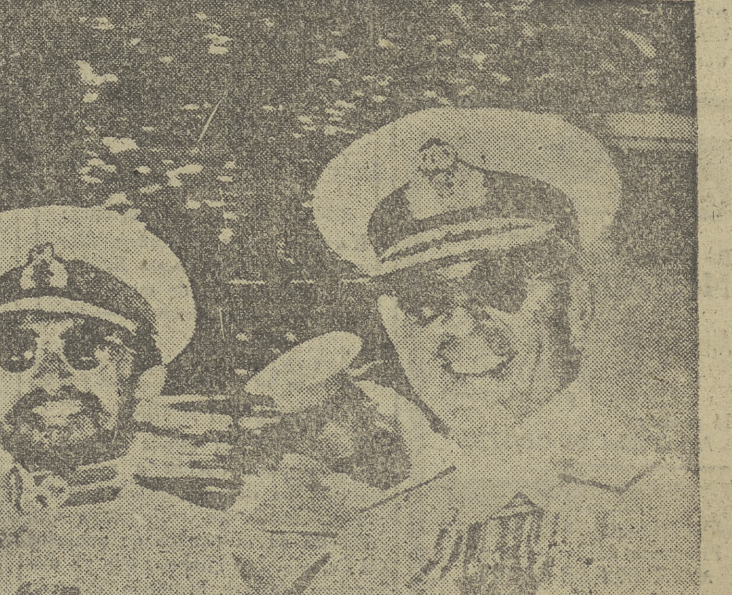
El Emperador de Etiopía, Haile Selassie, a quien todos conocemos e identificamos como El Negro, aparece en una clara actitud de saludo imperial, acompañado del Rey de Grecia, y momentos antes de su llegada a Atenas, donde reminiscencias clásicas parecen regir en su mano alzada.