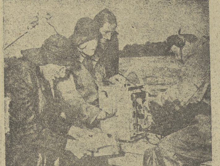
Los futuros y desventurados naufragos tienen una consoladora ayuda en este nuevo aparato transmisor-receptor sin hilos, que resiste la acción del mar y lanza continuamente el planifera S.O.S. Las pruebas han sido realizadas con éxito en el lago Wannsee, de Berlín.