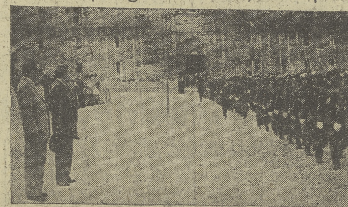
El ministro portugués de Defensa, junto al teniente general Muñoz Grandes, presenciando el desfile de las tropas que le rindieron honores.