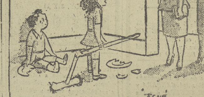
Jugábamós a mamá y papà.