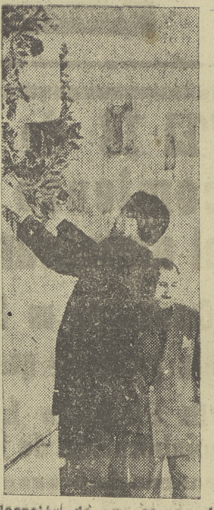
Colocación de una corona de laurel ante la Cruz de los Caídos.