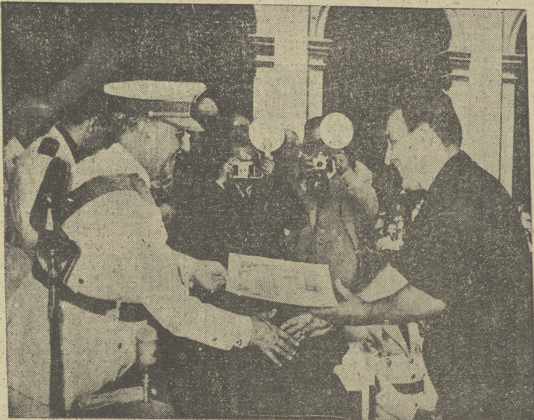
El Caudillo, en el acto de hacer entrega de los premios a los distintos galardondados, en presencia de los ministros y altos mandos sindicales.

representativo intermedio respecto de la base electoral, formada por diez millones de productores encuadrados en 12.474 entidades locales, que se descomponen en 3.375 Hermandades de Labradores y Ganaderos, 1.043 Gremios de Artesanos, 205 Cofradías de Pescadores y 2.251 Sindicatos Laborales.