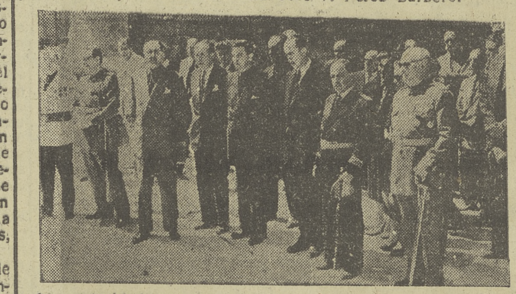
Las autoridades, a la salida de la misa celebrada por los caídos en la Catedral.

Los actos finalizaron con la inauguración de la Exposición en la sala municipal de Arte, donde exponen sus últimas obras los alumnos de la Escuela de "Educación y Descanso". De entre estos cuadros presentados, un Jurado competente emitió el fallo oportuno para la concesión de premios correspondientes.