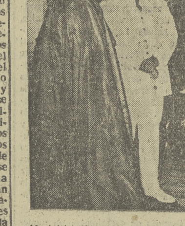
Madrid. (Servicio especial.)—Entre las audiencias civiles concedidas por S. E. el jefe del Estado ayer, figuró la Comisión de autoridades burgalesas, integrada por el Arzobispo de la Diócesis, capitán general de la Región, gobernador

Se interesó por los problemas de nuestra provincia S. E. se mostró conforme con el programa de fiestas cívicas