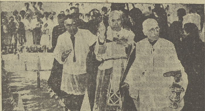
Momento de la bendición.

A las once de la mañana de ayer tuvo lugar la bendición y colocación de la primera piedra de la nueva capilla que las Franciscanas Misioneras de María van a erigir en los terrenos que poseen en la calle de San Julián.