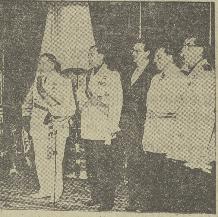
Madrid. (Servicio especial.)—Entre las audiencias civiles concedidas por S. E. el jefe del Estado ayer, figuró la Comisión de autoridades burgalesas, integrada por el Arzobispo de la Diócesis, capitán general de la Región, gobernador

Madrid, 14.—El Ejército de los Estados Unidos ha recibido hoy la primera entrega de municiones hechas en España bajo el programa "Off Shore". El acto se ha efectuado esta mañana en Puzol, donde radican las fábricas de "Cointra", entidad constructora, con asistencia de altos jefes del Ejército norteamericano, que han recibido el lote piloto de 2.500 minas antitanques, de las 250.000 contratadas. De ellas serán elegidas 26, que serán probadas próximamente en Madrid. El contrato de suministro de este material fué firmado en Alemania en julio del pasado año, es decir, antes del acuerdo hispanoamericano, y es el primero de esta clase en España. Salió entonces a concurso y resultó triunfante la Casa española. El valor del contrato es de 2.750.000 dólares, para la fabricación de minas antitanques pesadas.