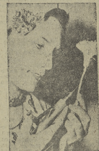
En Holanda se ha inventado recientemente un método eficaz para que las flores duren largo tiempo sin marchitarse. He aquí una florista inyectando el líquido que permitirá a esta flor alargar su vida hasta seis meses.