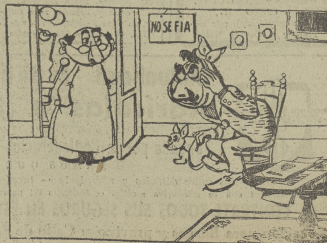
—¿Es usted el paciente? —Lo era, pero con tanta espera soy el impaciente!