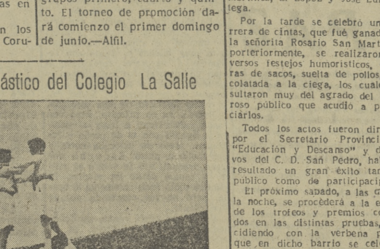
El grupo de mayores del Colegio La Salle practicó, el pasado domingo, en el festival gimnástico de la Plaza de Toros, unos arriesgados ejercicios en el que formaban torres humanas, como la que se ve en la presente foto.