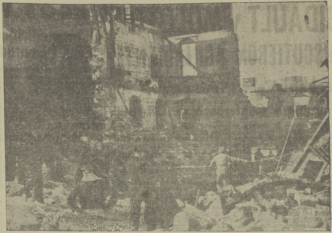
El fuego devorador ha pasado por aquí. La Compañía de Seguros es la única arma para luchar eficazmente contra las consecuencias de estas humanas tragedias.

tantas veces el gestor de ros de vida no se ha visto sigue viendo obligado a dar un diálogo como este promueve don Atilano? La vida frasecita es típico del cual se abroquelan no candidatos, unos de bue- y otros de mala. La ma- de estos últimos, claro recurren a ella como un xto, un estigio para salir paso. Cuando la dialéctica asegurador de turno es tan inciente que le pone en el to de no saber por dónde r el golpe que le asesta a goismo, a su despego a su lía, o simplemente a su in- presión, alegan, para sa- por la tangente, que no les tiene hacer el contrato, por- solamente "el negocio del uto está en morirse".