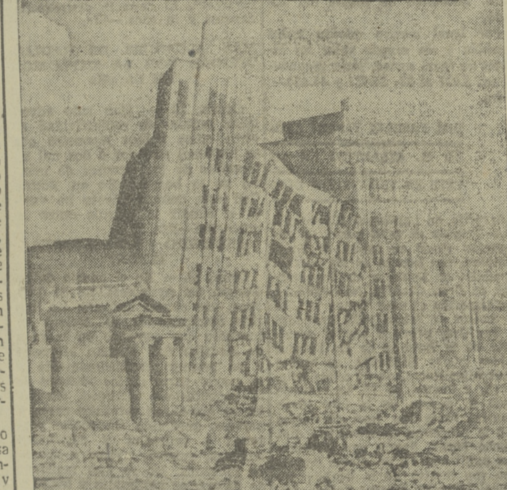
Estampas como ésta, de ruinas y catástrofes, son, deградaciadamente, frecuentes. Cuando tras ellas no hay una póliza, bien puede asegurarse que serán siempre un ejemplo alocador para los imprevisores.

entonces es cuando entra la tión en una nueva fase. No as veces resulta "obra de ro- nos", como suele decirse, di- dir al preopinante de su or. Convencerle de que la ración del Seguro nunca se enfocarse desde el punto vista de negocio, de motivo lucro para el asegurado; que que contrata una póliza de guro de Vida ha de pensar, te todo, en la previsión de brir el riesgo de un posible llecimiento prematuro; de har frente a las consecuencias sfavorables que en el orden ómico se le pueden presen- a los suyos al ocurrir tan uesto fin; y, en suma, que iverterir el Seguro en un ne- io bancario o mercantil es irtuar en absoluto su ver- fiera finalidad.