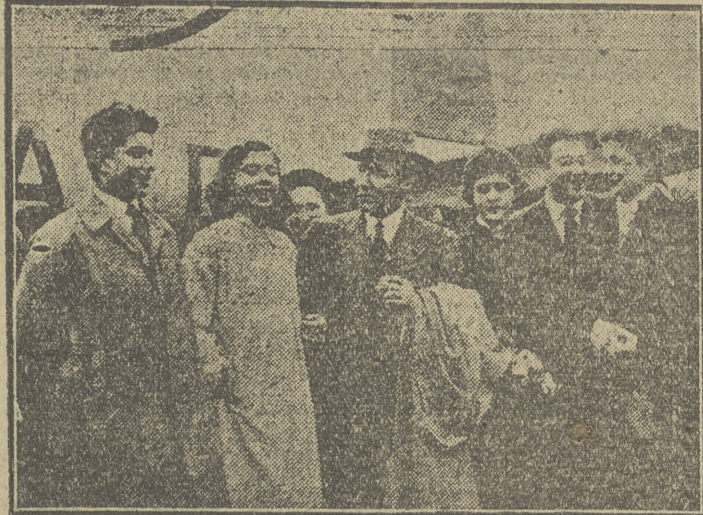
El ministro del Aire, general Gallarza, momentos antes de emprender su viaje a Estados Unidos desde el aeropuerto de Barajas.

Hoy, por la mañana, partirá para Washington