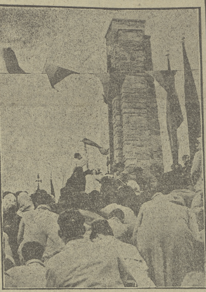
Zaragoza. — Conmemoración de la gesta de Alcubierre, donde se cubrieron de gloria las Banderas séptima y tercera de la Falange de Aragón.