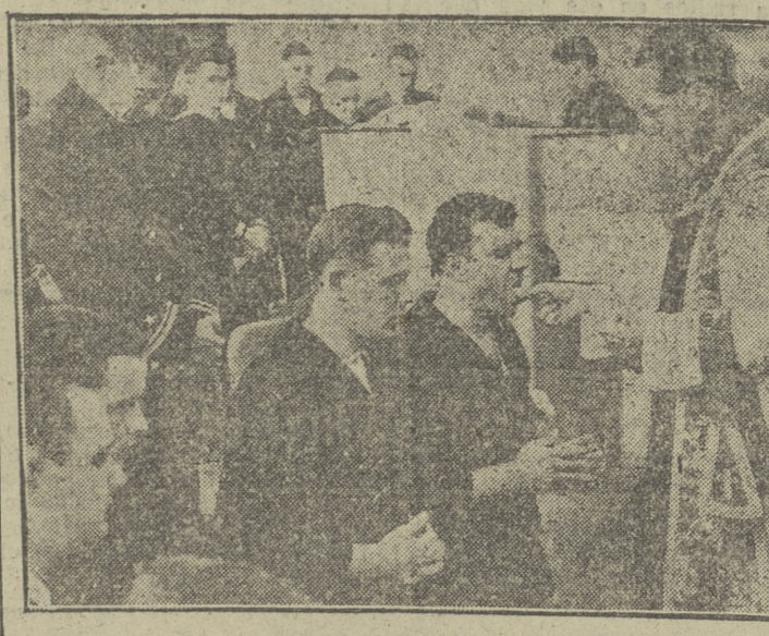
Málaga. — Con motivo del Domingo de Ramos fué pedid al señor Obispo una misa a bordo del buque norteamericano "Libra", a petición de los numerosos marinos católicos de la flota que se encuentra en este puerto. Un momento de la Comunion