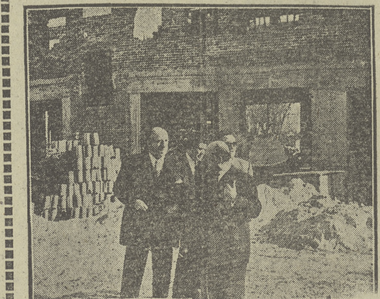
Se va a construir el gran bloque de casas en construcción, por un total de mil viviendas, bloque que dará una parcial solución al problema en Santander.