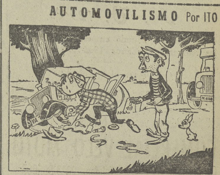
—Necesita algo? —No lo sé todavía; estoy contando las piezas.