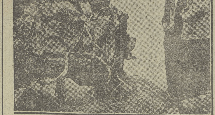
Ante uno de los motores del "Comet" caído en el Mediterráneo, prosiguen las investigaciones técnicas. Mientras tanto, los pasajeros acuden a otras líneas.