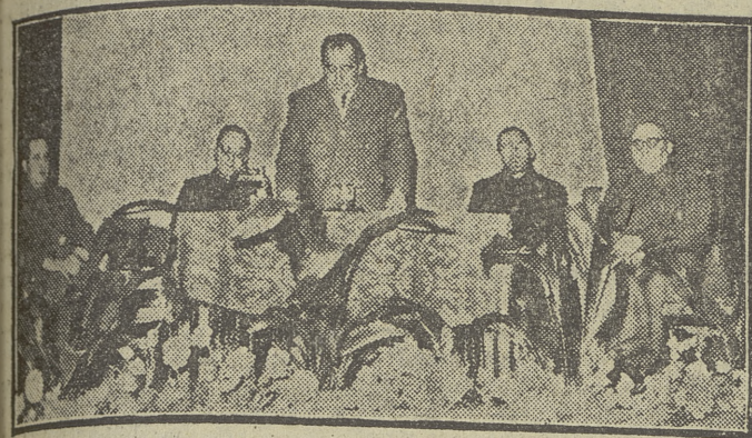
El señor Alcalde en funciones dirige la palabra al público que llenaba el Salón de Actos.

Con gran solemnidad quedó inaugurada la Escuela de Artes y Oficios de la Obra Social Arandina Padre Damián Janáriz, C. M. F.