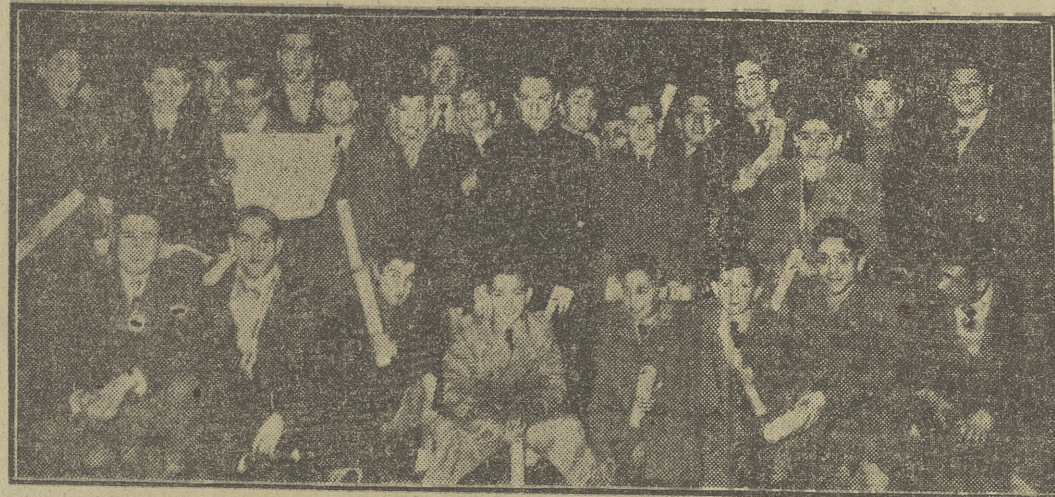
ENTREGA DE PREMIOS EN ACCION CATOLICA.