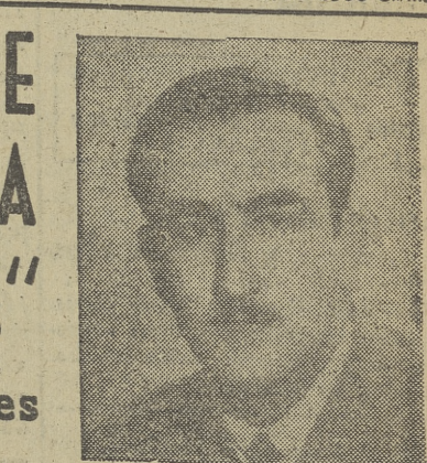
«Aranzadi»: «Es una obra original y exclusivamente aderezada para dar solución a los problemas con que se encuentran el abogado práctico y el perito médico.» «Boletín de Información del Ministerio de Justicia»: «... las dos vertientes, médica y jurídica, se funden en un afán de hacer asimilable la materia y facilitar al abogado y al juez la solución de cada caso concreto.» «Revista Nacional de Educación»: «Obra magistral; quien quiera tenga, que enfrentarse con estos problemas, habrá de acudir legítimamente a esta «Psiquiatría Jurídica, Penal y Civil» como lección de cuanto en este ambiente de materias han sabido componer, con sugerencias propias, sus autores.»