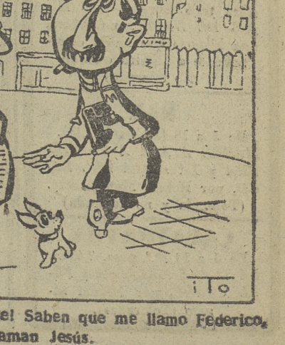
«¡Qué tontísima es la gente! Saben que me llamo Federico, pero cuando estornudo me llaman Jesús».

Washington, 22. — En unas declaraciones a la «United Press», el embajador del Pakistán en Washington, ha rendido tributo a los Estados Unidos por el estímulo y aliento dados a su país y a Turquía; para que concluyeran una alianza política y económica. «Esta es la primera vez en la historia—dijo el embajador—, que una gran potencia recibe con agrado y ánima la unión entre países orientales que desean una mayor colaboración». «En el pasado—añadió—y en especial en el siglo «XIX», los países europeos veían con malos ojos esa colaboración entre los asiáticos, y cuando veían que se iba a conseguir un arreglo intentaban separarlos». Asimismo, el embajador pakistani expresó su opinión de que la ayuda militar norteamericana ayudaría al Pakistán a cooperar en el fortalecimiento de la seguridad en el Oriente Medio.—Efe.