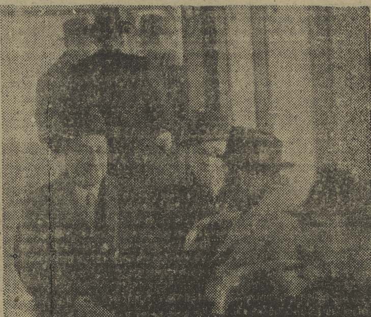
El conde de Madrid, conde de Mayalde; el marqués de la Valdavia y otras personalidades, durante el viaje inaugural de la línea de tranvías Gibeles-plaza de Castilla

"Estoy emocionado, señor embajador, por la amabilidad de vuestro presidente al quererme honrar con esta altísima conde-