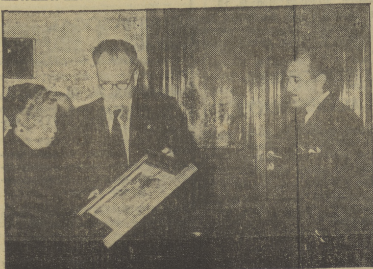
El alcalde de San Leonardo entrega el nombramiento de vecina perpetua de la Villa a la ciudad del florado general Yagüe, en presencia del gobernador civil.

La sucumbia ante la falta de unidad, estábamos acostumbrados a no tener permanentes intereses o ambiciones personales, a jugar con el leír de nuestra Patria, los más sagrados intereses de nosotros, pese a las dificultades con que tropezamos, a las que se acumulan en nuestro camino, pusimos el esfuerzo de los técnicos españoles, y hoy podemos esta muestra grandiosa de la eficacia de la política de nuestro Gobierno, al mismo tiempo que a los técnicos españoles.