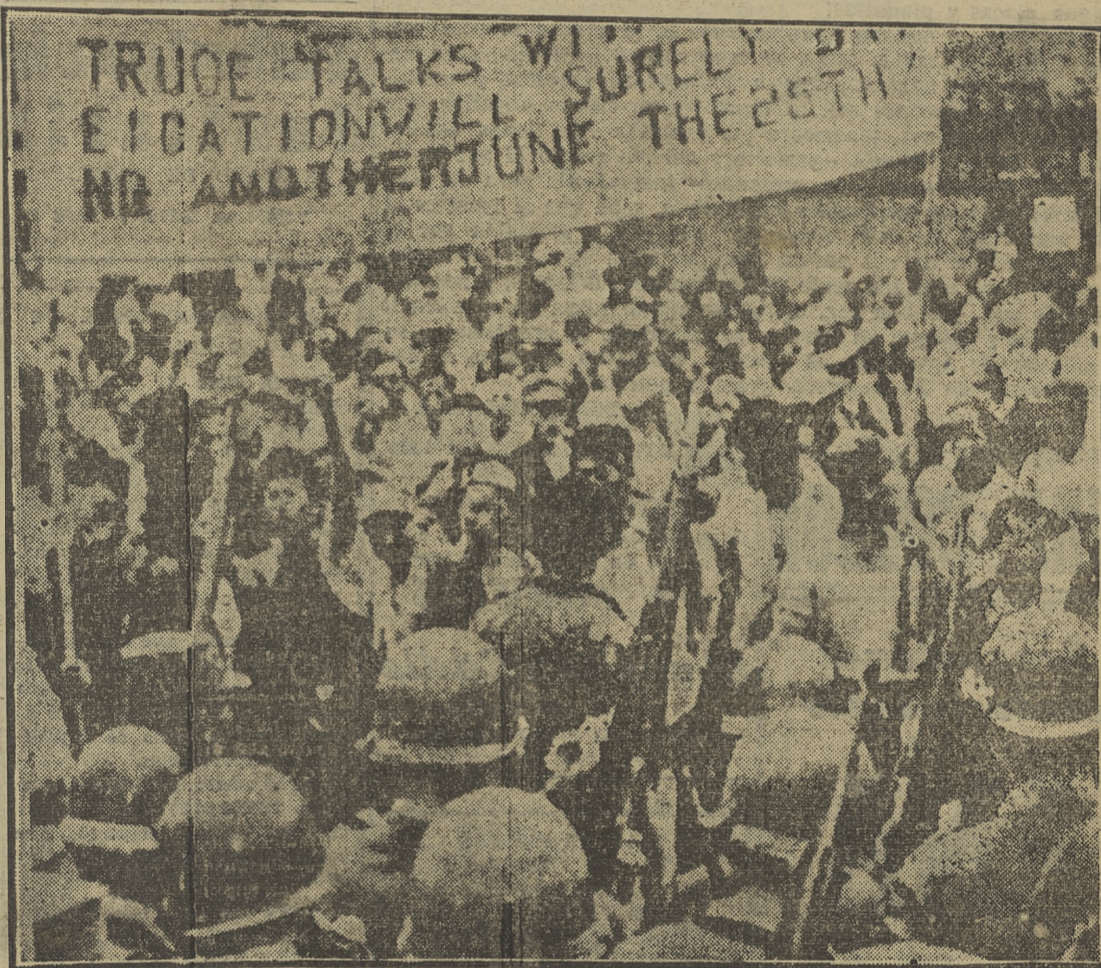
Cuando están para cumplirse tres años de guerra, en las ciudades de Corea del Sur arrebican las manifestaciones contra la tregua que se gestiona en Pan Mun Jom. "El armisticio nos traerá otro 25 de junio", dicen los cartelones, precisamente ahora que esa fecha va a repetirse por tercera vez

SEUL, 16. — Continúan los renovados ataques comunistas en el sector este-central, en el que los surcoreanos han perdido una posición. Unos quinientos aviones aliados castigan a los rojos a lo largo de todo el frente en ataques en masa. Mientras tanto parece que el final de la lucha en Corea tardará por lo menos una semana. Por otra parte, se hace observar que no se ha anunciado todavía el acuerdo formal sobre la composición de los equipos de las naciones neutrales que han de tener a su cargo la ejecución de las cláusulas del armisticio.