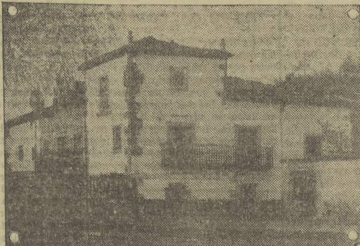
Villarcayo tiene todavía en su censo a varias familias que remontan su ascendencia a los tiempos del nacimiento de Castilla. Viejas casas solariegas —como la que ofrecemos en esta foto— afirman esta continuidad de una espléndida tradición

Fue capital del Corregimiento de las siete Merindades de Castilla la Vieja hasta los primeros años del siglo XVI, en que don Carlos, el emperador, ordenó la formación de un expediente especial y le otorgó la supremacía con la aplicación del nombre mandado quedara así formado el Corregimiento de Villarcayo, declarándole jefe de los Merinos de Castilla la Vieja, Valdi-