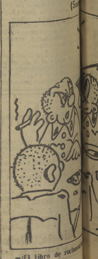
—El libro de reclamos