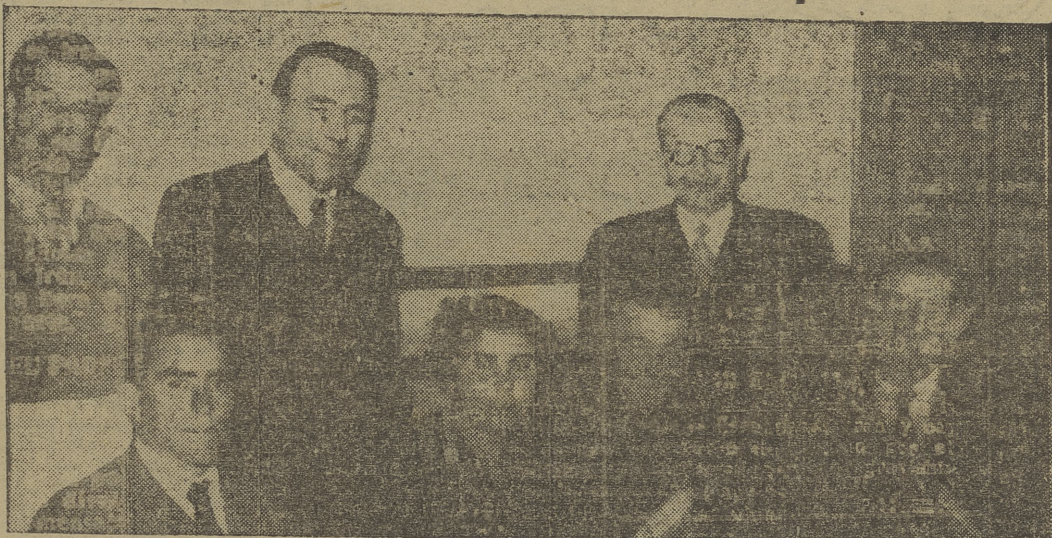
Los afortunados ganadores del premio INTER de esta semana

Accediendo a justas demandas de un amigo al que tanto debemos por amistad como por adhesión a la marca INTER y coincidiendo con la clausura de nuestra oferta INTER LE ESPERA EN