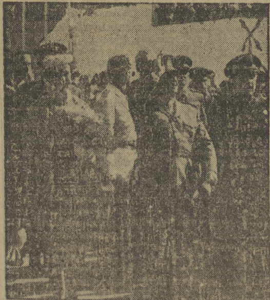
El Caudillo, durante su discurso en Córdoba en el V centenario del nacimiento del Gran Capitán. -- El jefe del Estado y su esposa reciben las aclamaciones del pueblo cordobés.