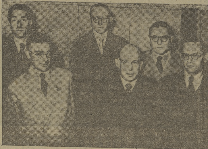
Funcionarios del I. N. P. de Burgos que han sido premiados por su trabajo en la institución.

Por la tarde, a las seis y media, se procedió a la entrega de premios a los funcionarios que han resultado ganadores en los diversos concursos efectuados, y por último se proyectó un interesante documental por los equipos cedidos al efecto por la Caja de Ahorros Municipal.