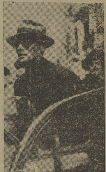
Gregory Peck, durante la visita que ha realizado a Valencia

Por otra parte, se han adoptado todas las medidas necesarias para hacer frente a las circunstancias que puedan presentarse por un año agrícola deficiente".