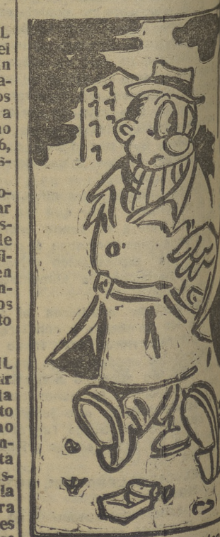
Les enseñan muy bien a trabajar con coordenados.