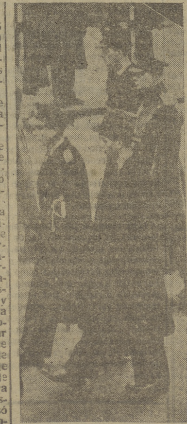
El duque de Windsor, junto al duque de Kent y al de Gloucester, en el momento de su real hermano.

Los duques embarcaron en la motora del almirante y se dirigieron al Yacht Club, donde fueron recibidos por el gobernador de la isla; a continuación, el duque revisó a un Cuerpo de tropas canadienses estacionado allí. El día 17 de agosto desembarcaron en Nassau, y quince minutos después recibía juramento de fidelidad como gobernador y comandante militar de las Bahamas. El presidente del Consejo Legislativo y el de la Asamblea Representativa le dirigieron sendos mensajes de bienvenida. La población negra le aclamó también con entusiasmo. El resto del otoño lo pasó el duque dedicándose a conocer, a fondo, las islas y sus problemas. En un discurso radiado en Nassau, a mediados de diciembre, puso de relieve el valor y la energía de dos marinos