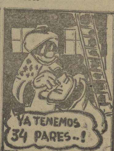
«Noche de Reyes»