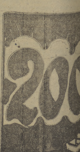
«La cien y ciento» (Chispa)