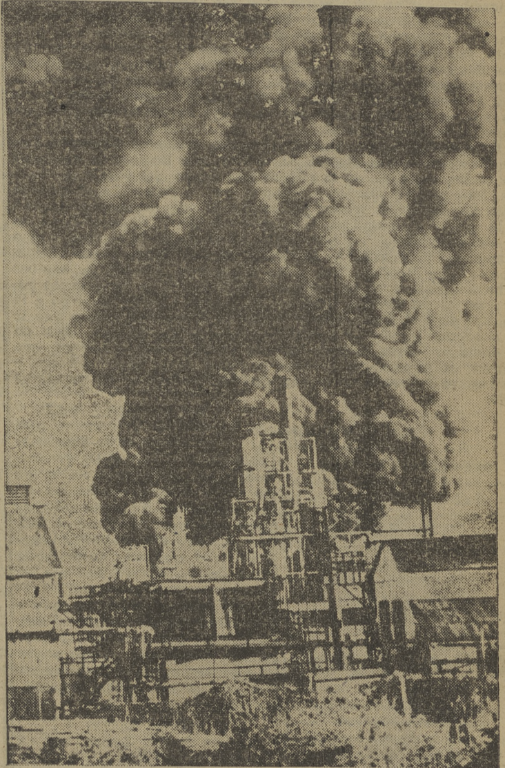
La fotografía da una idea de lo que fué el incendio que, debido a una chispa de ferrocarril, se produjo en las destilerías de la organización oficial de petróleos, y que originó pérdidas de petróleo de más de cinco mil metros cúbicos.