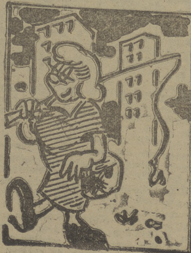
«En busca de marido»