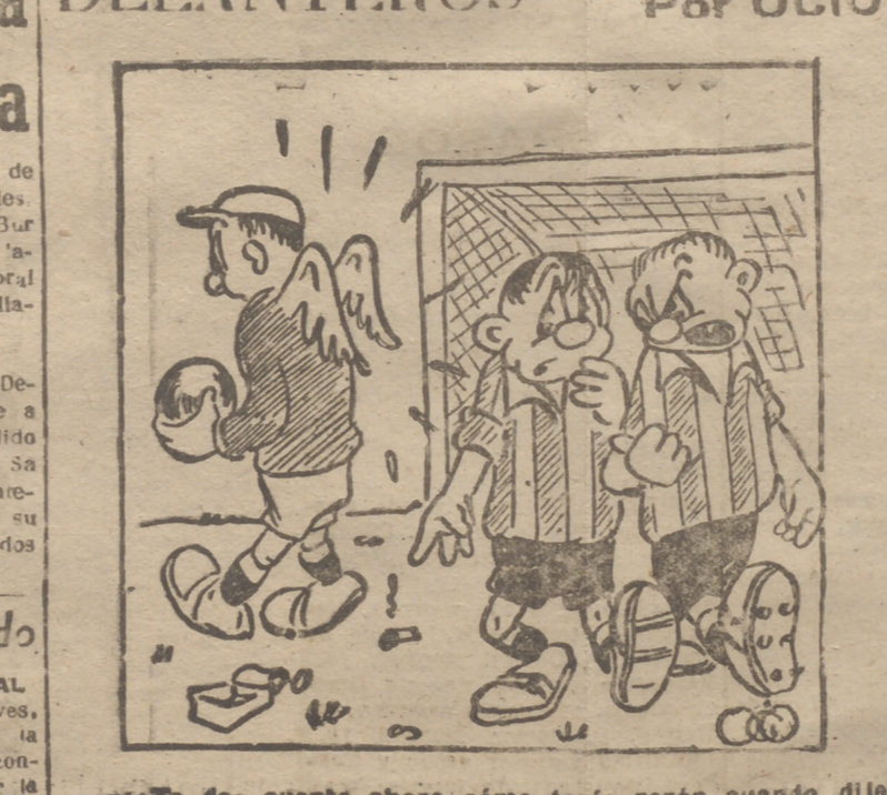
¿Te das cuenta ahora cómo tenía razón cuando dije que paraba mucho por algo...?!