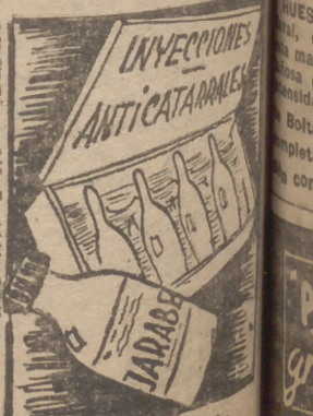
"Eva al desnudo"