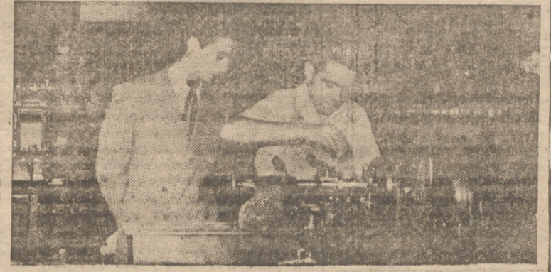
Una escena de las pruebas de la fase provincial correspondiente al Concurso de Formación Profesional Obrera "Voluntad de Resurgimiento"

Frente de Juventudes ha opuesto el concepto del trabajo como un deporte más, o, por mejor decir, como el más noble de los deportes. El trabajo no es exclusivamente un penoso deber divino, sino también una honrosa ocupación. El afán que persigue el Frente de Juventudes es estimular a las fábricas y empresas para que mejoren sus propios medios de trabajo y llevar a todos los aprendices el deseo de superación, la alegría del trabajo. Además, con estos concursos los muchachos aprenden la rara virtud de saber perder con dignidad.