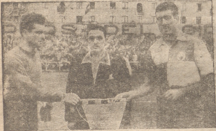
Villafranca captó en esta instantánea el momento en que el capitán del Burgos hace entrega al del Sabadell del banderín que perpetúa la fecha del primer partido oficial que el once catalán ha jugado en nuestra ciudad.

despliegue catalán nuestra defensa retrasó su situación, obligada por los contrarios, y quedó mucho campo sin cubrir convenientemente, ya que nuestros jugadores son lentos en la acción y si un terreno reducido lo defienden con valentía, ante los rápidos jugadores catalanes, que a sus facultades físicas unen mejor control y dominio de pelota, y una veterania adquirida en su participación anterior en esta y en superior categoría, la inferioridad técnica se hizo patente y en un corto espacio de tiempo se incubó el triunfo del visitante.