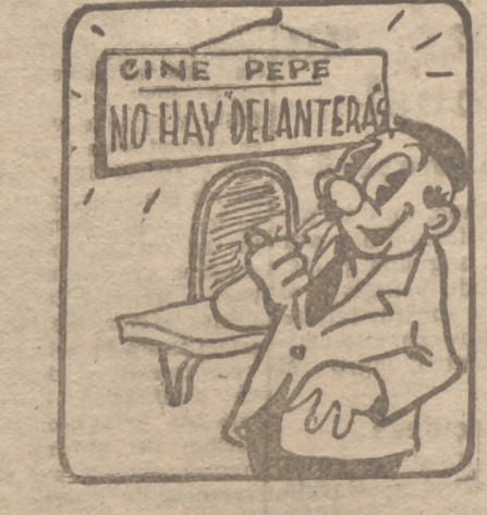
OBSESION --¡Creí que estaba en Zatorre...!