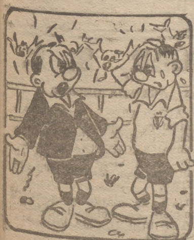
IMPOSIBILIDAD --¡De verdad que no he traído más "penaltys", hombre...!