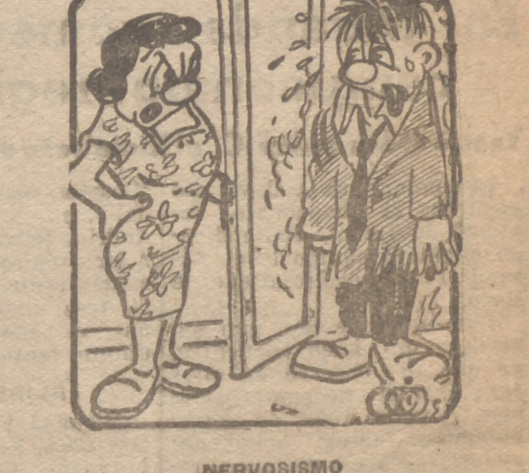
NERVOSISMO --¡Ya ha vuelto a perder el Burgo... ¿verdad?...