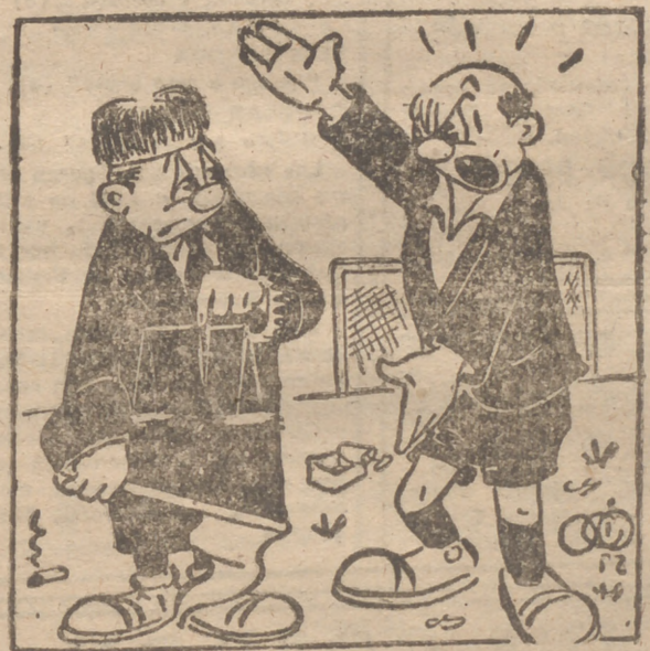
—¿Pero usted qué se ha creído que es ser juez de línea...?!!