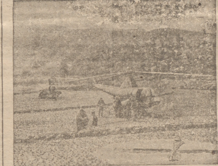
El helicóptero (que aparece en la foto) se ha convertido en un medio de la guerra moderna.

FRENTE DE COREA. — (Servicio especial de crónicas “Efe-United Press”). No es tarea fácil la de realizar el salvamento de pilotos caídos en aguas del mar Amarillo o del mar del Japón, particularmente agitada en este período del año.