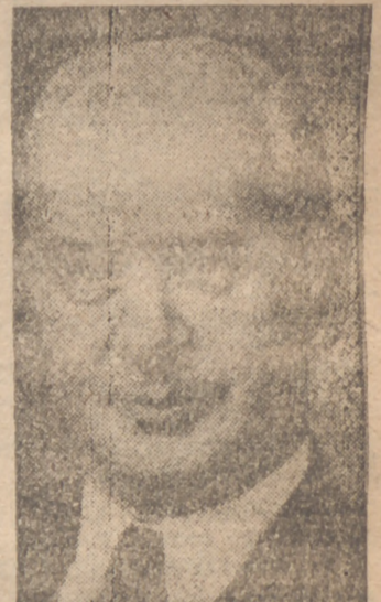
Philip Murray, presidente del C. I. O. (Congreso de Organizaciones Industriales), falleció el domingo, en San Francisco, a consecuencia de un ataque al corazón.