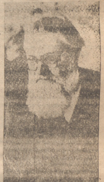
A las seis de la mañana del domingo falleció en su residencia de Jerusalén el presidente del Estado de Israel Chaim Weizmann.

MADRID, 10. -- Su Excelencia el Jefe del Estado y Jefe Nacional de la Falange ha concedido la Palma de Plata al consejero nacional de F. E. T. y de las J. O. N. S., recientemente fallecido, don Juan Yagüe Blanco, capitán general y marqués de San Leonardo de Yagüe. (Cifra).