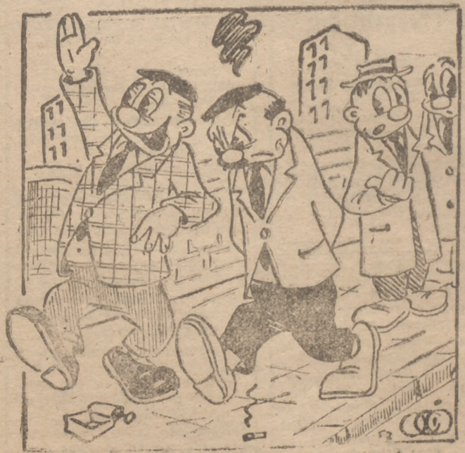
—¡El de este lado es dueño de una industria...!