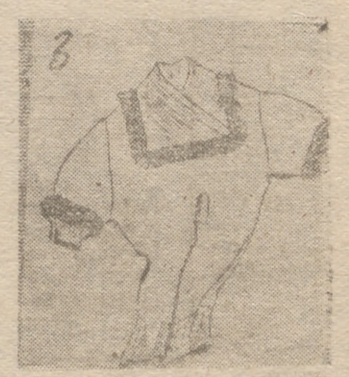
3. -- "Pull" de punto negro guarnecido de una triple franja de fleco de oro. -- LANVIN CASTILLO