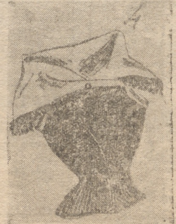
4. -- Para la noche. -- Blusa de punto negro, "fichu" de organza melva envolviendo los hombros y bordado de fleco de lana. HEIM