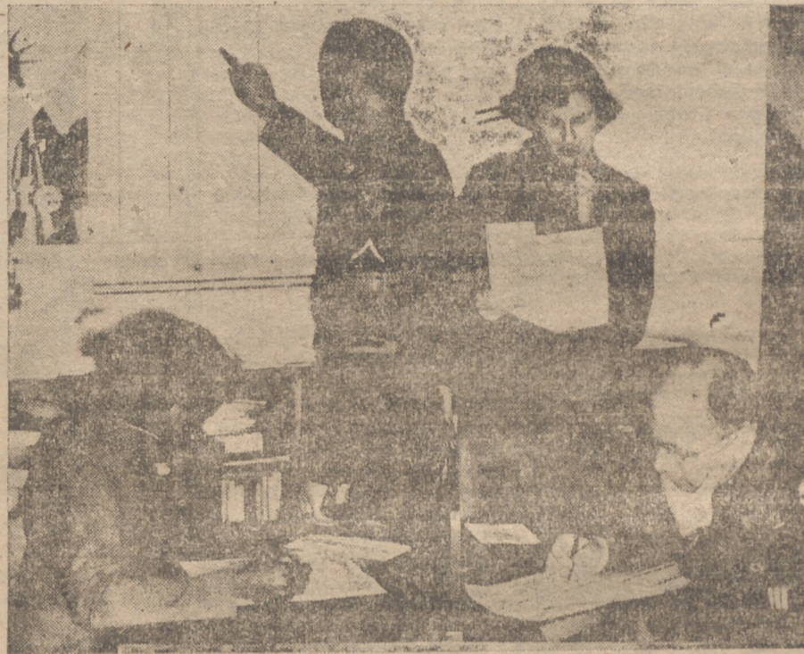
Las fuerzas americanas en Alemania también elegirán a su preferido para la presidencia el 4 de noviembre. En la foto, una oficina electoral militar en plena actividad, en Francfort

Año VIII - Núm. 2.206 | Burgos, Domingo, 2 de Noviembre de 1952 | Precio: 70 céntimo