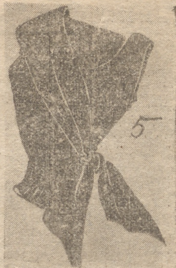
5. -- Blusa muy de vestir, en punto negro. Escote redondo y echarpe cruzado que anuda sobre el costado izquierdo. El echarpe está forrado de organza rosa y lleva un estro biais en el mismo color y tejido al borde del escote y de la sisa. -- FATH