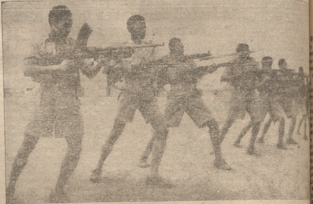
Soldados del nuevo Estado judío se entrenan con armas modernas en uno de los campos históricos más viejos del mundo

Los judíos ortodoxos de Israel han dejado estoicamente los frutos en los árboles los campos sin labrar para cumplir el viejo precepto del Levítico