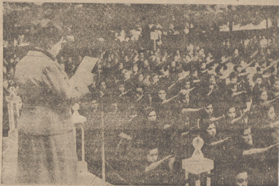
En los Jardines de la plaza de Oriente ha tenido lugar el acto del paso de las flechas de la Sección Femenina a la Falange, presidiendo Pilar Primo de Rivera.

Año VIII - Núm. 2.192 | Burgos, Viernes, 17 de Octubre de 1952 | Precio: 70 céntimos