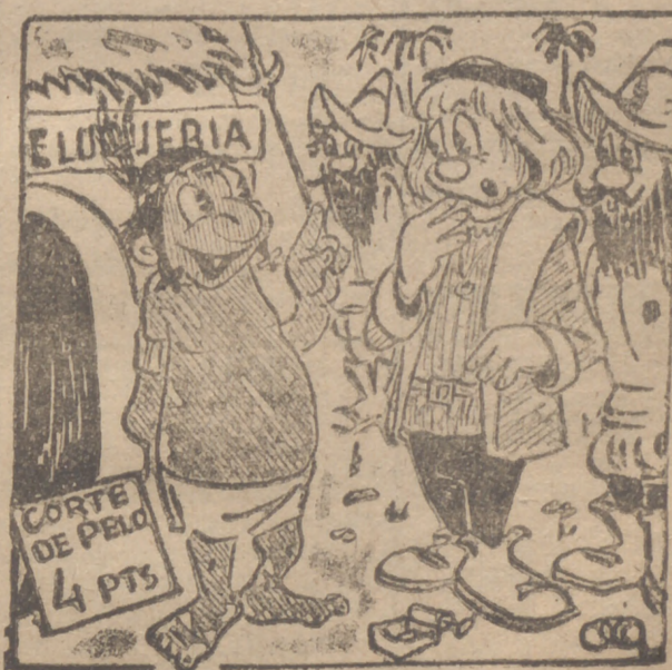
— ¡Allí también han aumentado las tarifas, ¿eh?!

de nuestros redactores, en la que ha señalado haber podido apreciar los satisfactorios progresos logrados en los trabajos de instalación de la futura fábrica de automóviles (Pasa a última página)