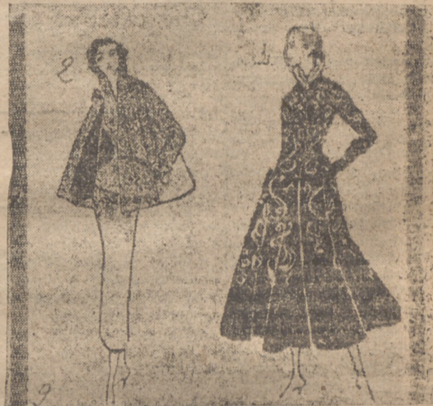
2.—Gene Tierney pasa sus vacaciones actualmente en Francia. Ha elegido un traje sastre en "Iwed" gris y blanco. Chaqueta amplia en la misma tela, forrada de nubria negra. Asimismo ha escogido un "redingote" en terolopelo negro, bordado y guarnecido de visón en el cuello y mangas.