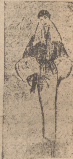
1.—Zizi Jeanmaire ha escogido, para tarde, un vestido recto en "Iwed" negro y blanco. Chaqueta amplia en la misma tela, con gran cuello en castor.

CUANDO beso tu cara, amor mío, para hacerte sonreír, sé bien cuál es el placer que chorrea del cielo en la luz de la mañana y el deleite que traen a mi cuerpo las brisas del verano... Cuando beso tu cara, amor mío, para hacerte sonreír.