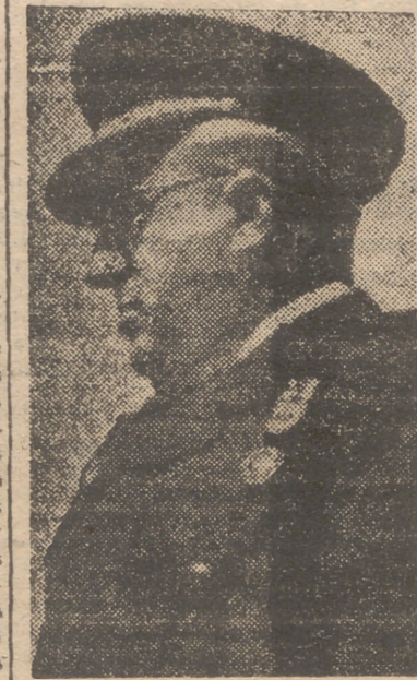
Gran africanista es el general Yagüe. Marruecos recuerda su figura prócer de soldado y hombre de España; su huella está en las tierras africanas y en la voluntad de sus gentes ganadas.

gir material y espiritual del protectorado. Además, otros diversos y capitales servicios, son atendidos con la misma generosidad por España. Y todavía en los días de angustia y privaciones generales que siguieron a la última conflagración, cuando el mundo nos negaba el pan y la sal, España compartía con el Marruecos hermano su trigo y sus alimentos, e