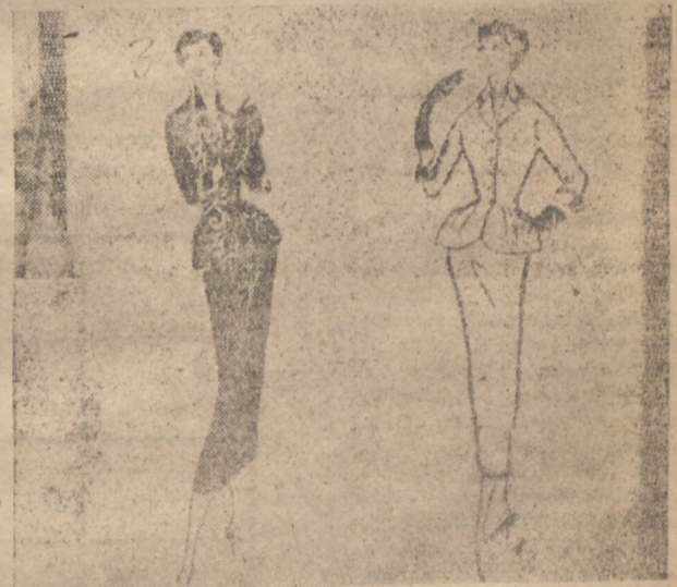
3.—Claudette Colbert, cuyo guardarropa es casi enteramente "made in U. S. A.", se ha quedado con un elegante modelo para cocktail. Se trata de un "ensemble" con cuerpo en muselina, falda en lana negra y chaqueta en faya negra, bordada. También ha escogido un traje sastre en lana negra, con terciopelo de igual color en cuello y detalles.