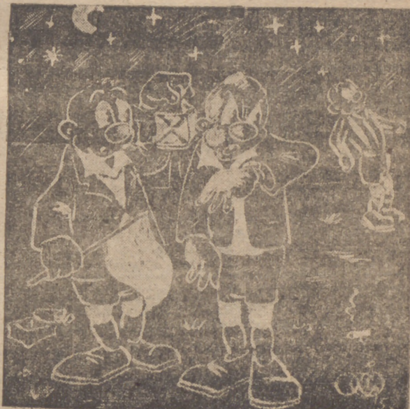
— Ya decía yo que este reloj atrasaba algo...!