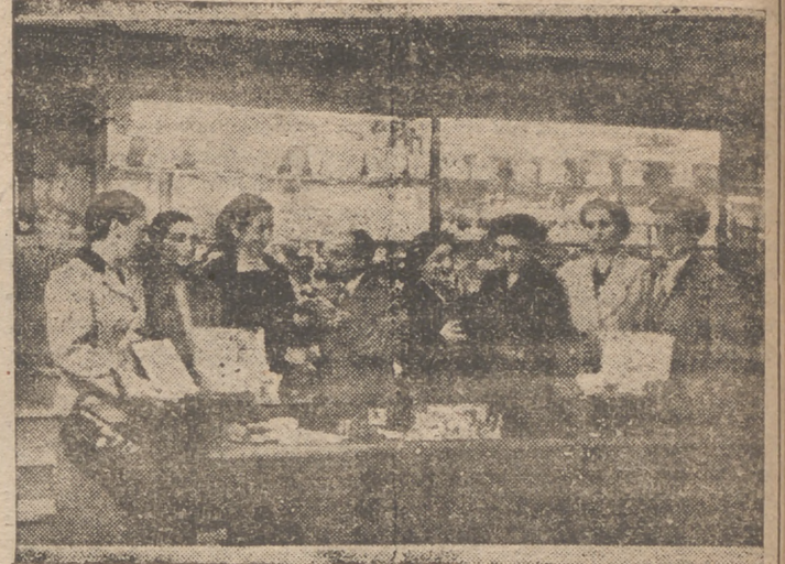
Reproducimos el momento de la entrega de premios por el señor Mariscal, en su establecimiento de Queipo de Llano, 7, a la agraciada con las 5.000 pesetas del primer premio y a las que lo fueron con los cinco siguientes