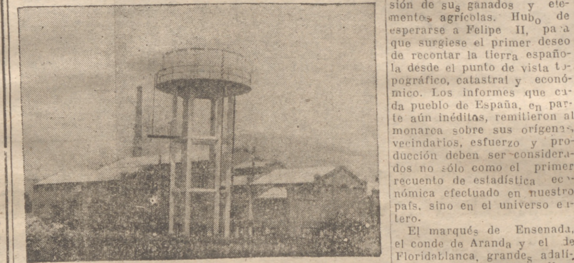
Victoria que esta generación actual se va a apuntar en la gran historia de la Patria.

Cada año, con su modesta envoltura azul, el "Anuario Estadístico de España" nos llega como un clarín de nuestro esfuerzo. No hay mejor emoción para un español amante de su Patria que el repaso de esas largas columnas de guarismos, en que de año en año puede ir contemplando el resumen numérico del esfuerzo continuado, tesonero y triunfal de un pueblo que siempre fué grande, y que hoy tiene la "rebeldía" de no querer conformarse con el puesto secundario que viene intentando colocarse desde hace algunas décadas de años.