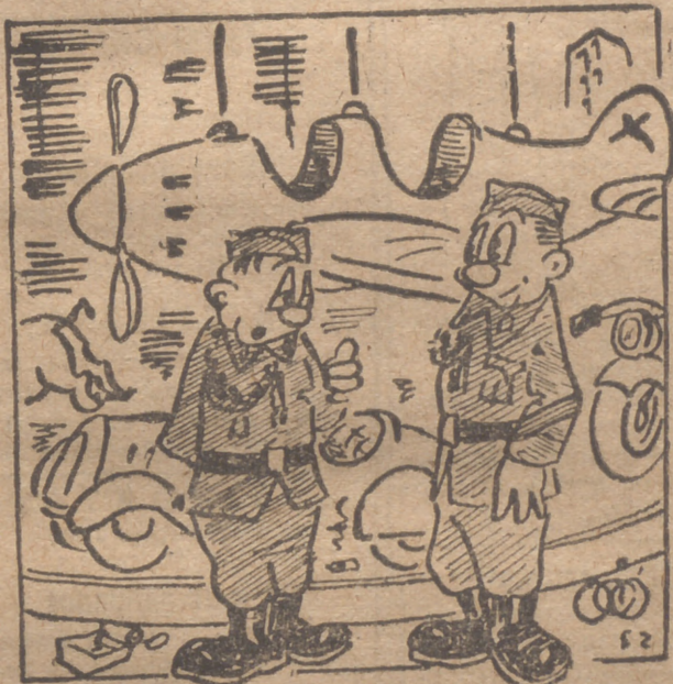
¡Móntate conmigo, hombre, que es que a mí no me dejan, todavía, volar solo...!