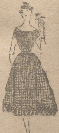
3. -- Vichy cuadrado. Falda de cuatro trozos al bias, fucidos en la cintura. El borde inferior de la falda va adornado de pasamanería de algodón blanco con gruesos pompones. El tejido es en verde y blanco.