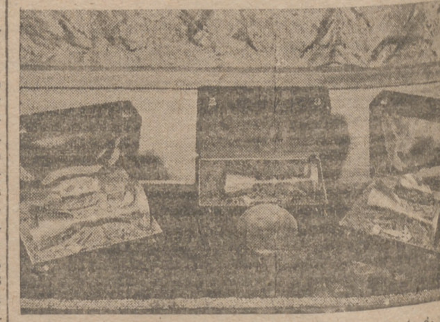
Cálices donados por la Caja de Ahorro y Monte de Piedad del Círculo Católico de Obreros de Burgos a tres de sus becarios de nuestra Diócesis, que ayer fueron ordenados sacerdotes en Barcelona, a cuyo acto asistió una representación de la Caja burgalesa.

Una entusiasta salva de aplausos acogió las últimas palabras del legado pontificio que con las mismas demostraciones de filial cariño y entusiasmo fué despedido por los asistentes a este acto.