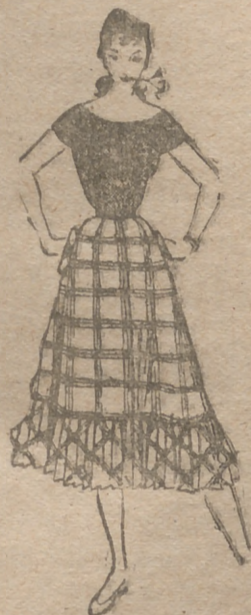
1. -- En vichy escocés. Hecha de cuatro trozos, abotonada atrás y con bolsillos de cartera a los costados. Volante al bias y picado en el borde de la falda.

La eficacia de la papaina se confirma a simple vista: los tejidos se disuelven casi ante nuestros ojos, lo que constituye una de las demostraciones más sorprendentes.