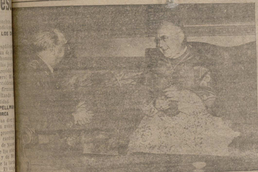
del Estado conversando con el cardenal norteamericano Spellman, en audiencia especial concedida por el Caudillo al ilustre purpurado.

Año VIII - Núm. 2.081 | Burgos, Domingo, 1 de Junio de 1952 | Precio: 70 céntimos