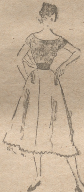
2. -- Gabardina blanca. Dos paneaux en forma sobre los costados y delantero y espalda al hilo. Bolsillos de tapa en forma, adornado de trenchilla gigante, al igual que el bajo de la falda, en color vivo. Cinturón corselete en el mismo tono que las trenchillas.