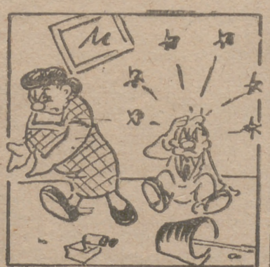
"Sangre en las manos"