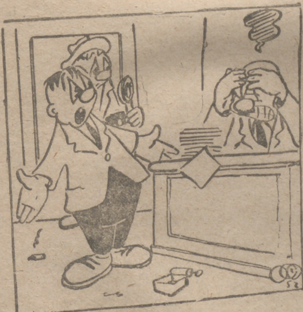
«Si la máquina no tenía cinta, yo no tengo la culpa, señor director...!»