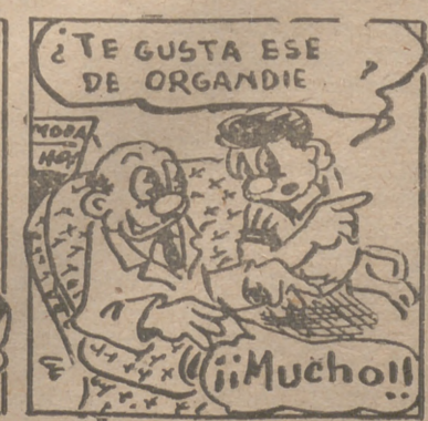
"¿Te gusta ese de Organdie?"